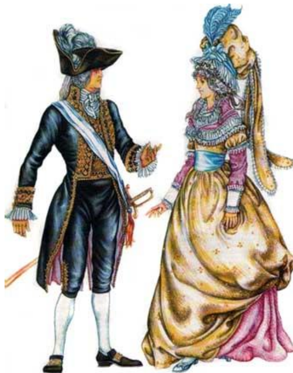
Костюм периода Великой Французской Революции.