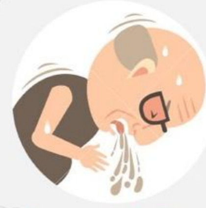
Nausea and Vomiting