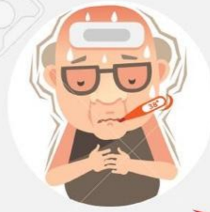
Fever and Chills