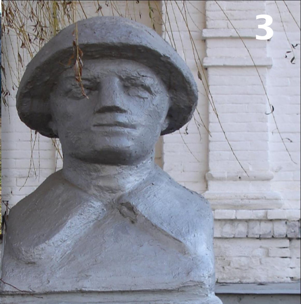
Бюст Героя Советского Союза – Матросова Александра Матвеевича (1924 – 1943)