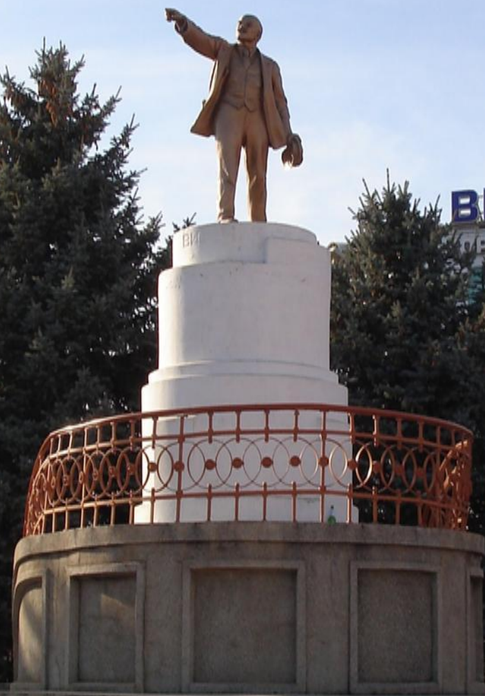
Памятник В.И. Ленину На центральной городской площади