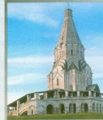
Церковь Вознесения. 1532 г. Москва, Коломенское