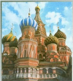
Храм Василия Блаженного в Москве. 1555–1561 гг.