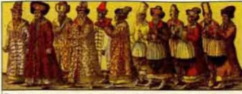
Русское посольство к германскому императору