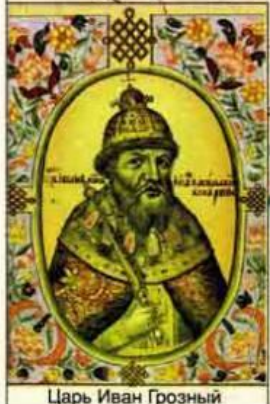
Царь Иван Грозный