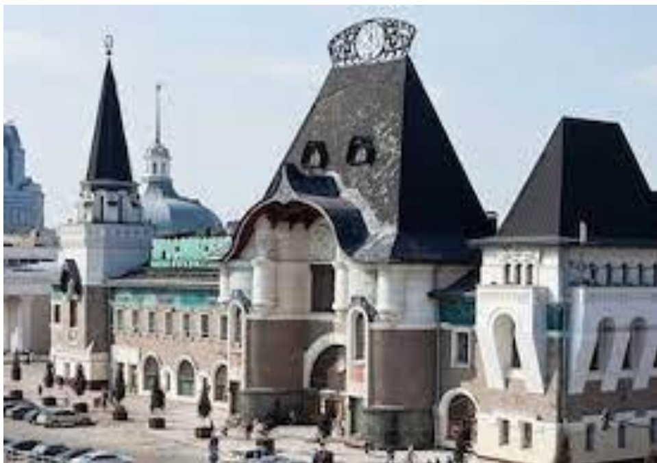
• Ярославский вокзал в Москве