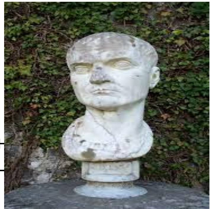
Гай Цильний Меценат ( 70 до н.э. – 8 н.э. )