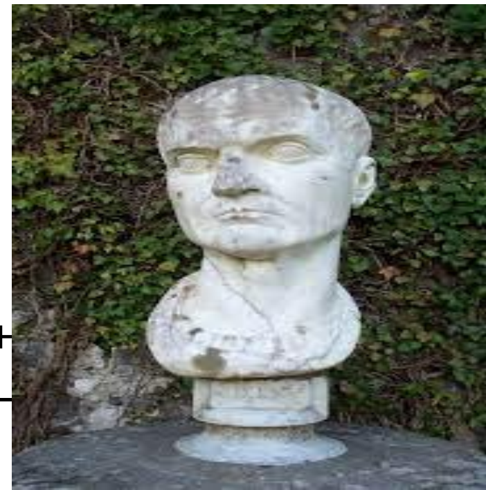
Гай Цильний Меценат ( 70 до н.э. — 8 н.э. )