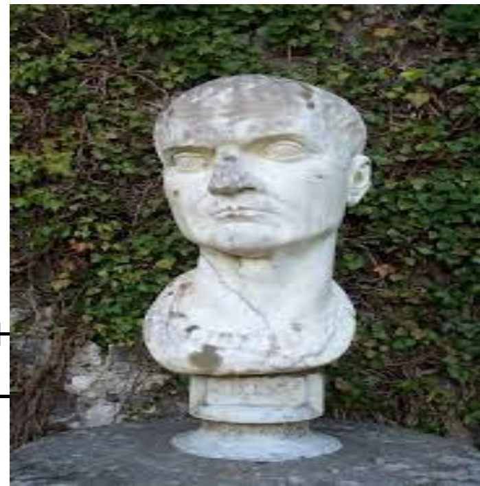
Гай Цильний Меценат ( 70 до н.э. — 8 н.э. )