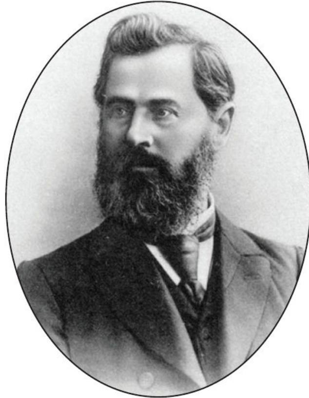
Павел Борисович Аксельрод