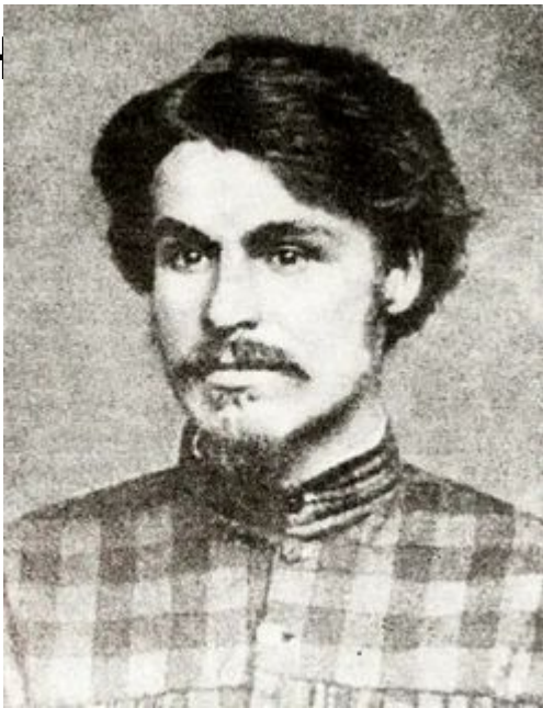
Халтурин Степан Николаевич