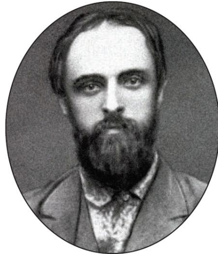
Александр Николаевич Потресов