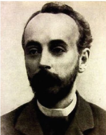
Глеб Максимилианович Кржижановский