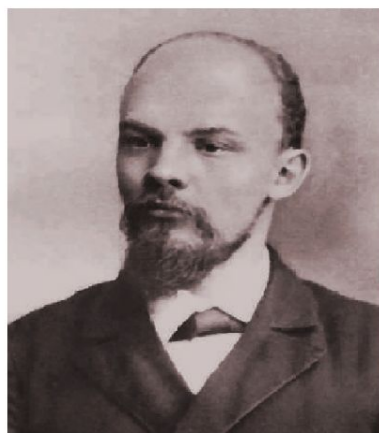
Владимир Ильич Ульянов (Ленин)