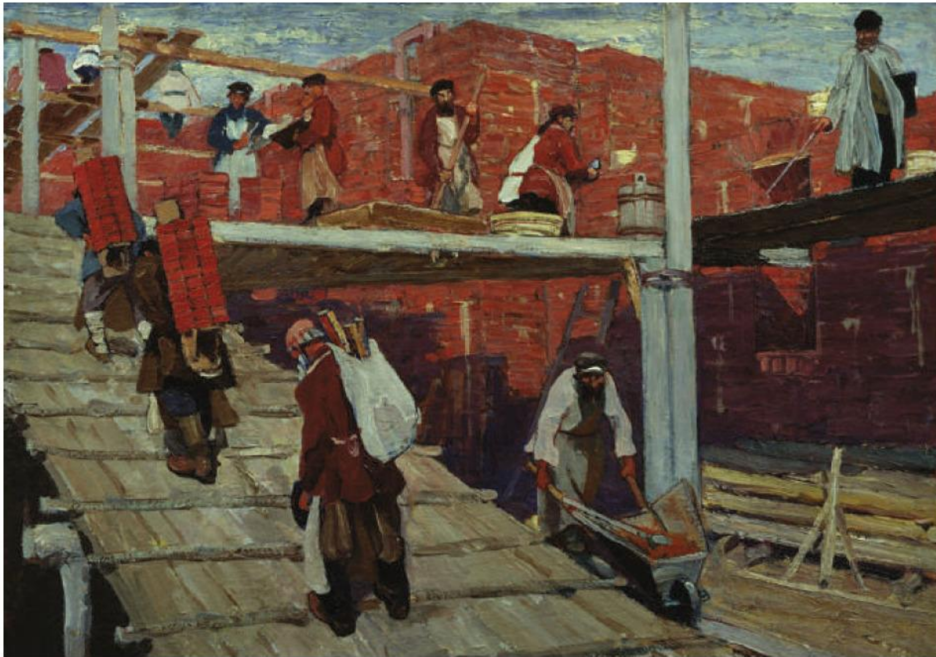
Строительные рабочие. Художник С.В. Малютин