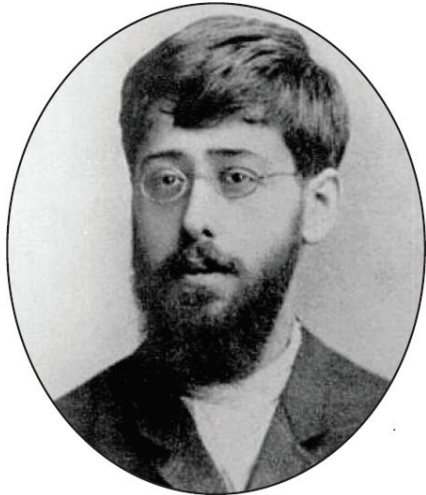
Юлий Осипович Мартов (Цедербаум)