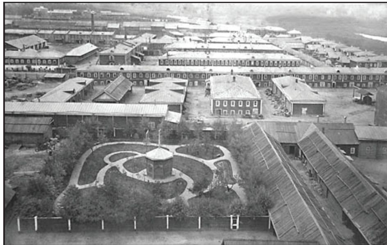
Никольская мануфактура Т. Морозова с сыновьями