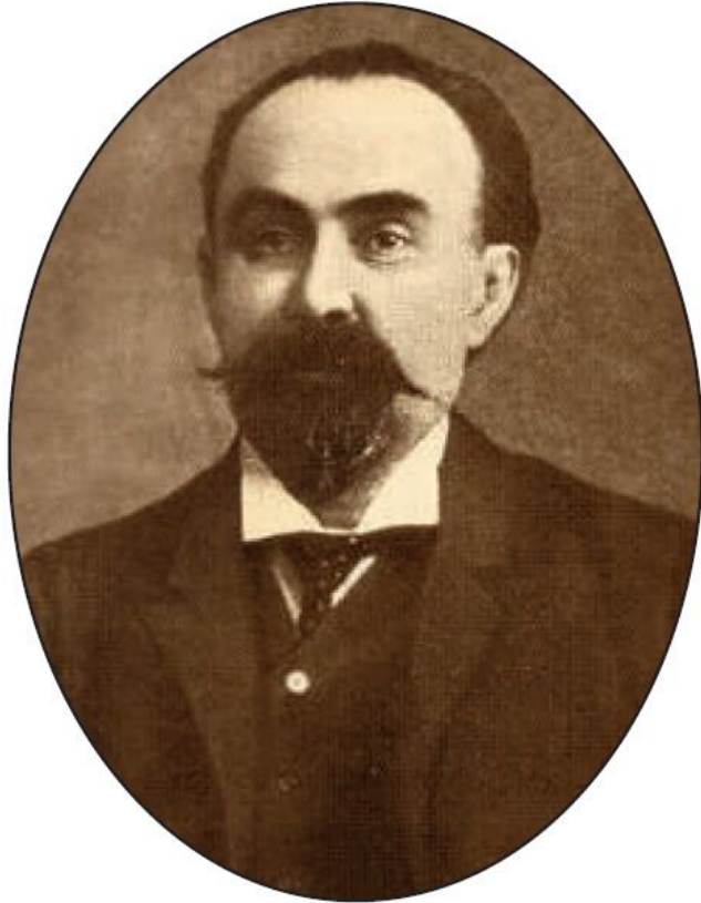
Георгий Валентинович Плеханов