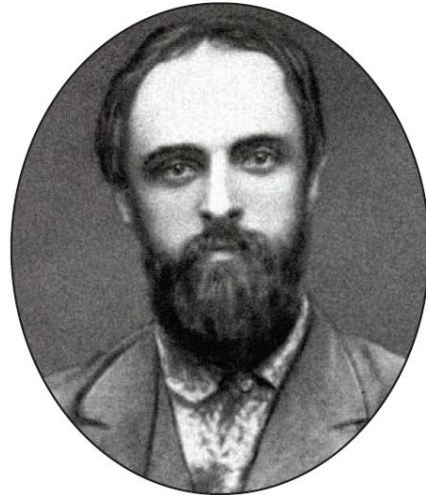
Юлий Осипович Мартов (Цедербаум) Александр Николаевич Потресов