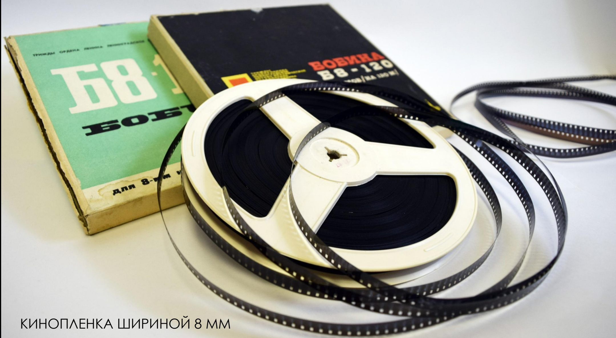
КИНОПЛЕНКА ШИРИНОЙ 8 ММ