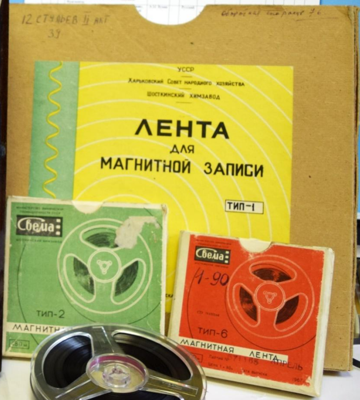
ФОНОДОКУМЕНТЫ МАГНИТНОЙ ЗВУКОЗАПИСИ