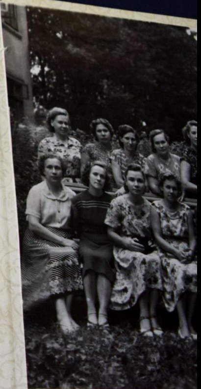
Перед уходом на пенсию, по...