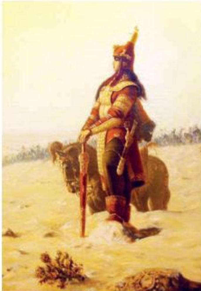
Царица Томирис. Художник А. Дузельханов