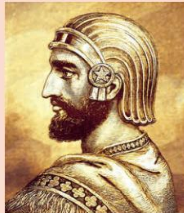
Рис. 2. Царь Персии Кир