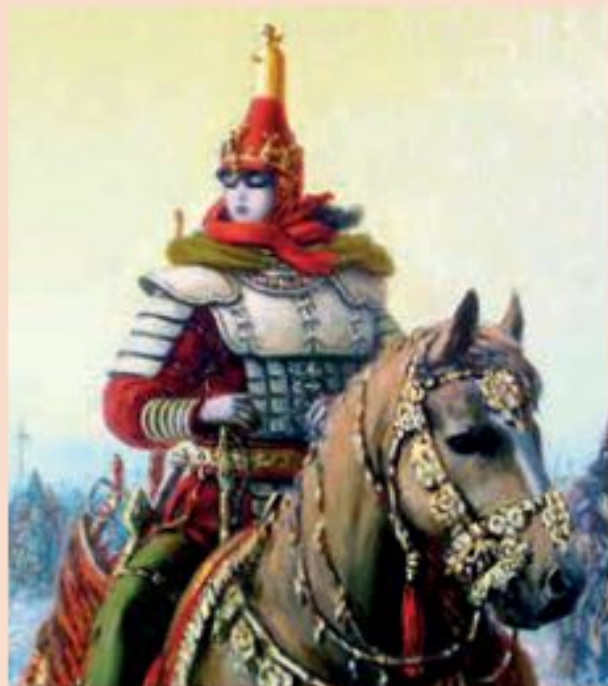
Рис. 1. Царица массагетов Томирис

Попробуйте предположить дальнейшее развитие событий.