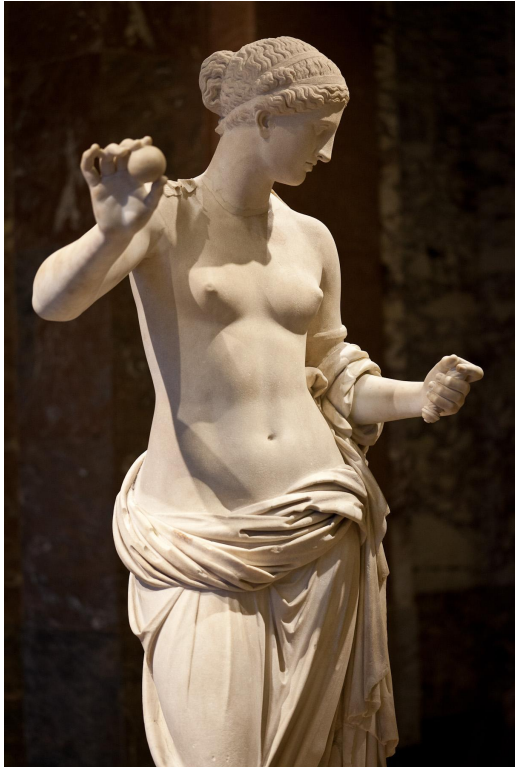
Статуя богини Афродиты