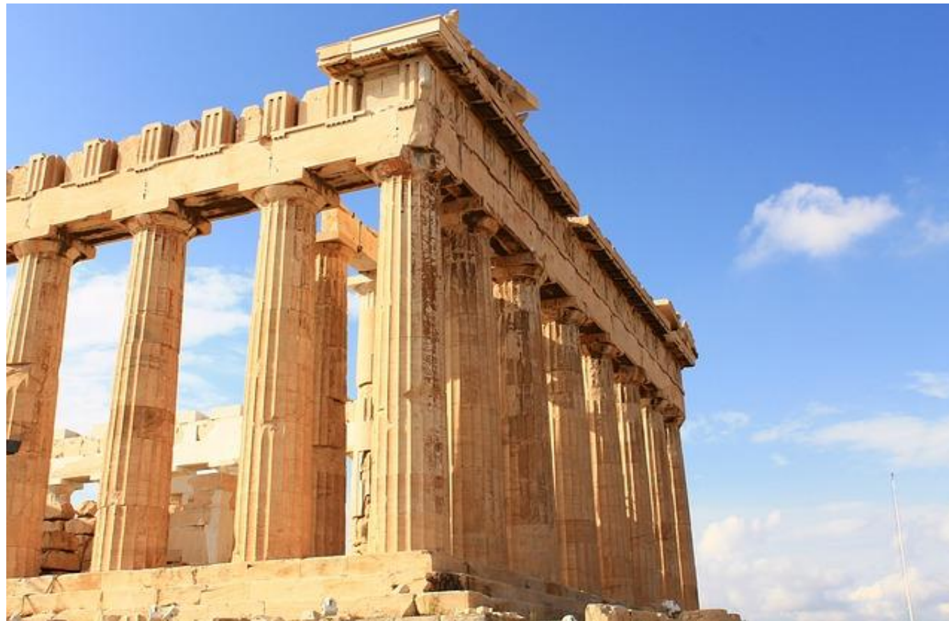
Главный храм Акрополя Парфенон