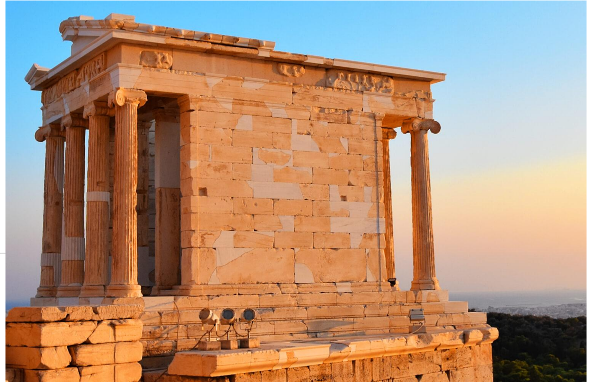
Храм богине победы Нике