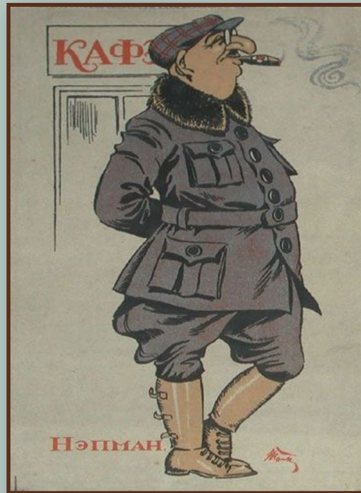
Нэпман. Реклама. 1920-е г.

Задачи социалистического строительства, установление принципов социальной справедливости требовали отказа от той политики, которая породила и усиливала капиталистические элементы, а также негативные явления в обществе. Наступление на частный капитал началось во второй половине 1920-х гг. Значительно увеличивались налоги, отменялись арендные договоры, сокращались денежные и товарные кредиты частникам. Был взят курс на вытеснение частного капитала из сферы производства, финансов и торговли, на постепенное свёртывание новой экономической политики.