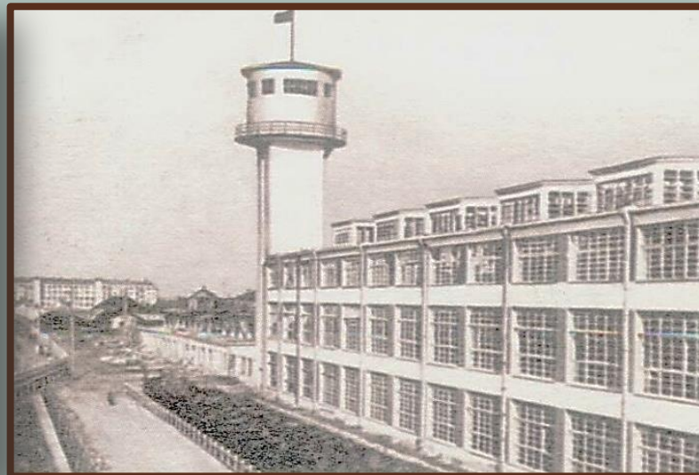
Чулочно-трикотажная фабрика «КИМ» в Витебске. 1931 г.

В БССР были созданы новые отрасли промышленности – топливная, машиностроительная, радиотехническая, химическая, налажено производство искусственного волокна и трикотажа. Сформировались инженерно-технические кадры, выросли кадры рабочего класса. Множество специалистов и квалифицированных рабочих было подготовлено в профессионально-технических учебных заведениях, а также на фабриках и заводах.