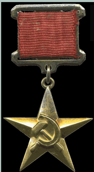
Медаль «Серп и молот» (вручалась Героям Социалистического Труда)