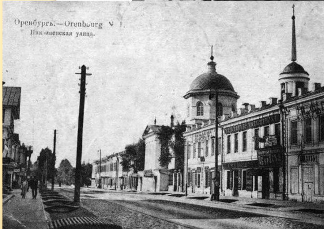
Поездка С.Есенина в Туркестан в 1921 году.