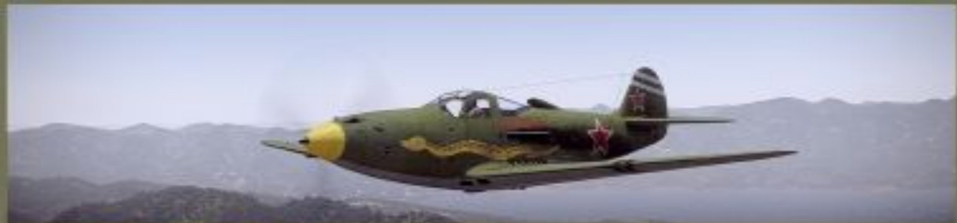
P-39 Амет-Хан Султан