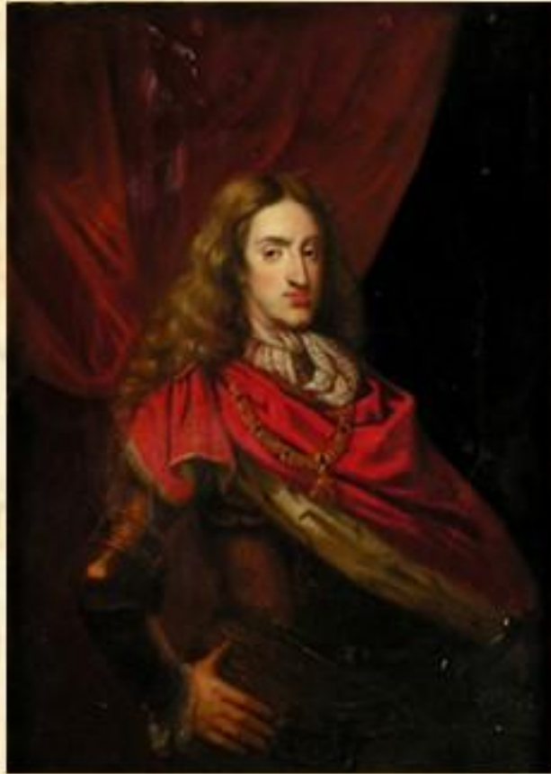
Карл II Габсбург (Испания)