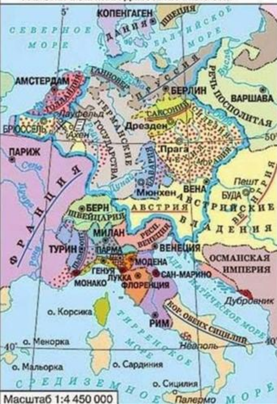
РАЙОНЫ ВОЕННЫХ ДЕЙСТВИЙ В ЕВРОПЕ