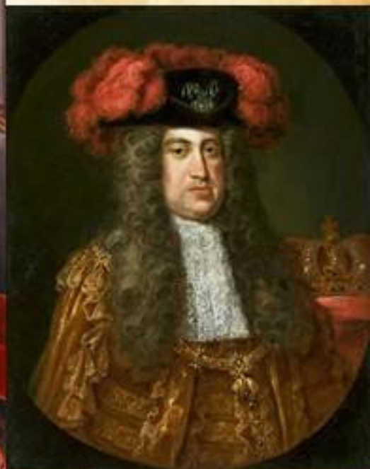
Карл VI Габсбург