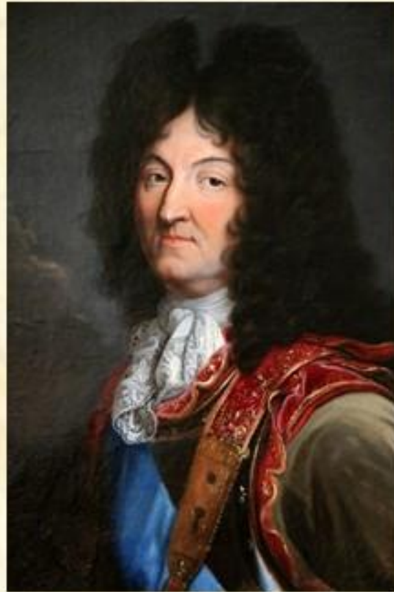
Людовик XIV Бурбон (Франция)