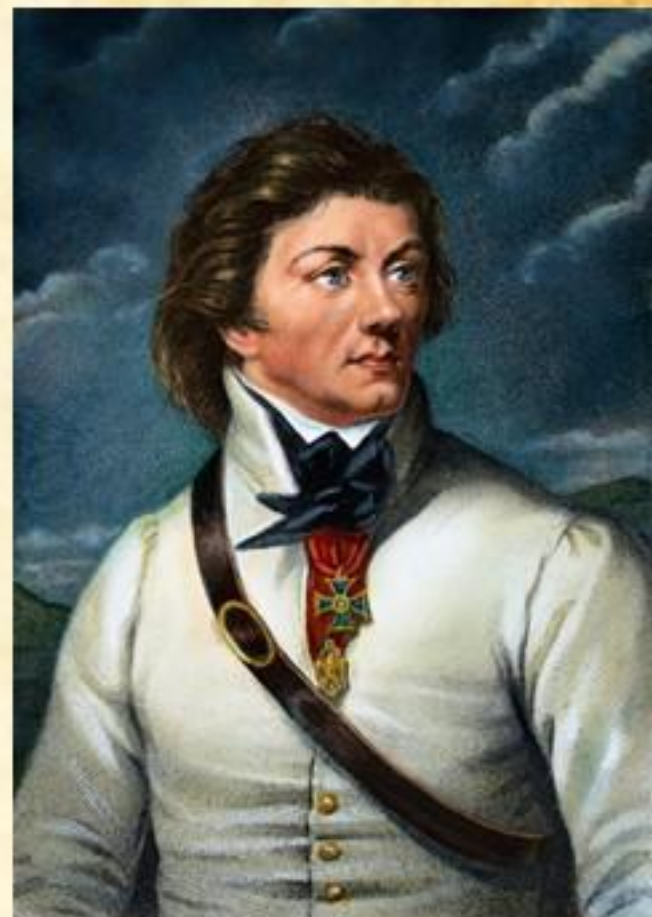
Тадеуш Костюшко. Восстание 1794 г.