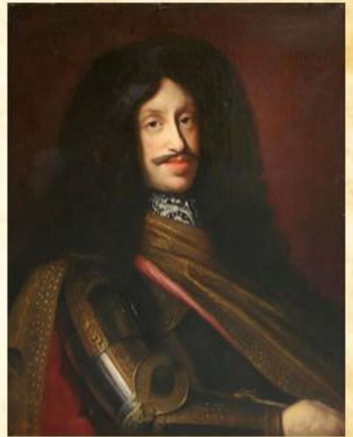
Леопольд I Габсбург (Австрия – Священная Римская Империя)