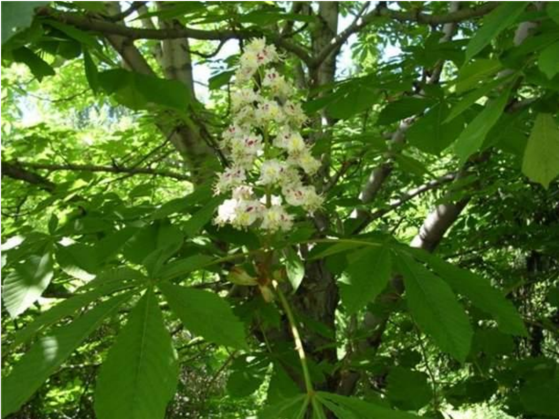
Каштан настоящий дерево