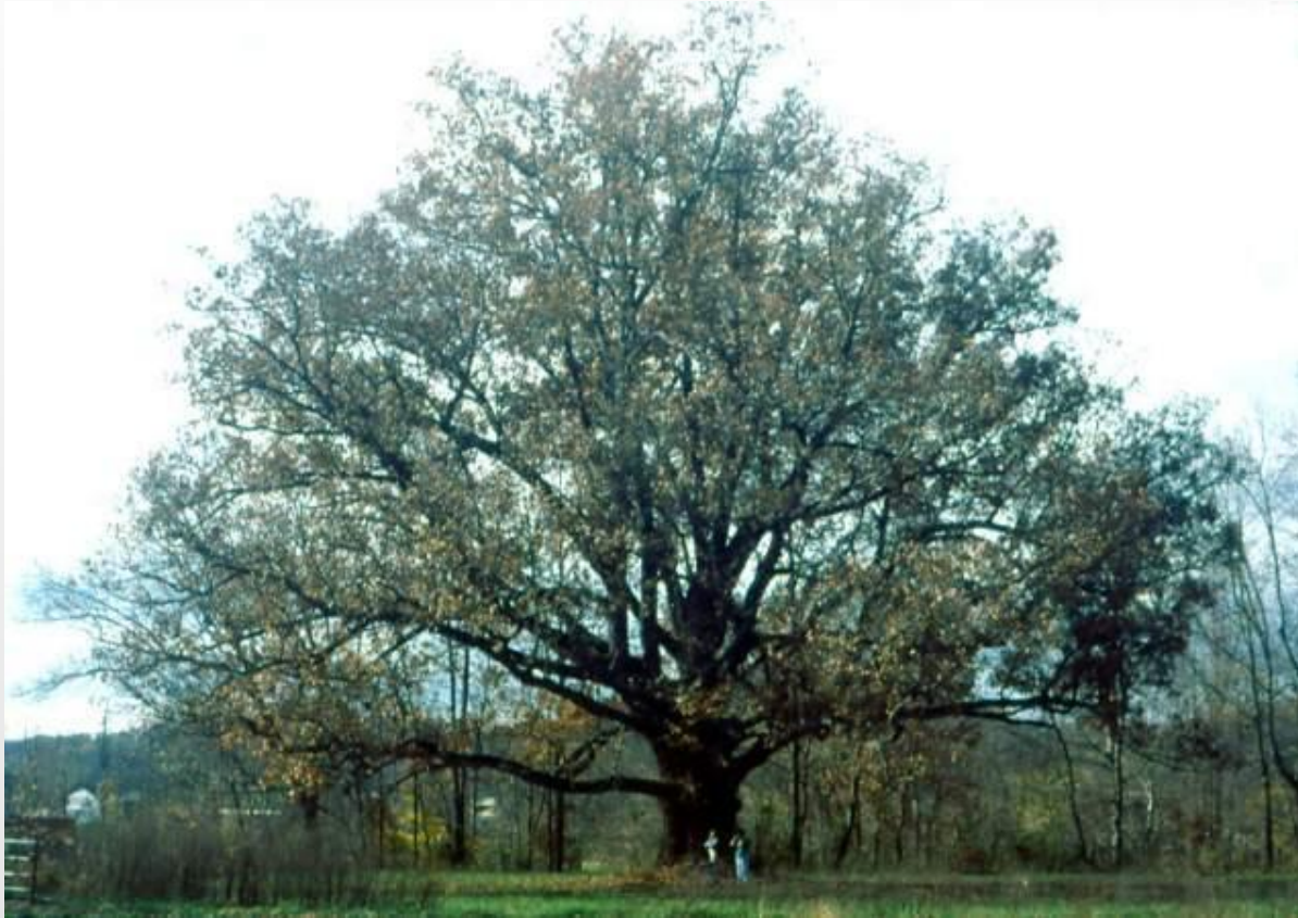
Белый дуб Секвойя