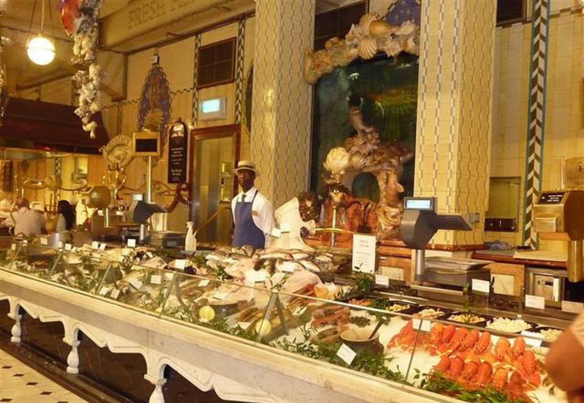
Harrods Food Hall -Fish Department Market Stall