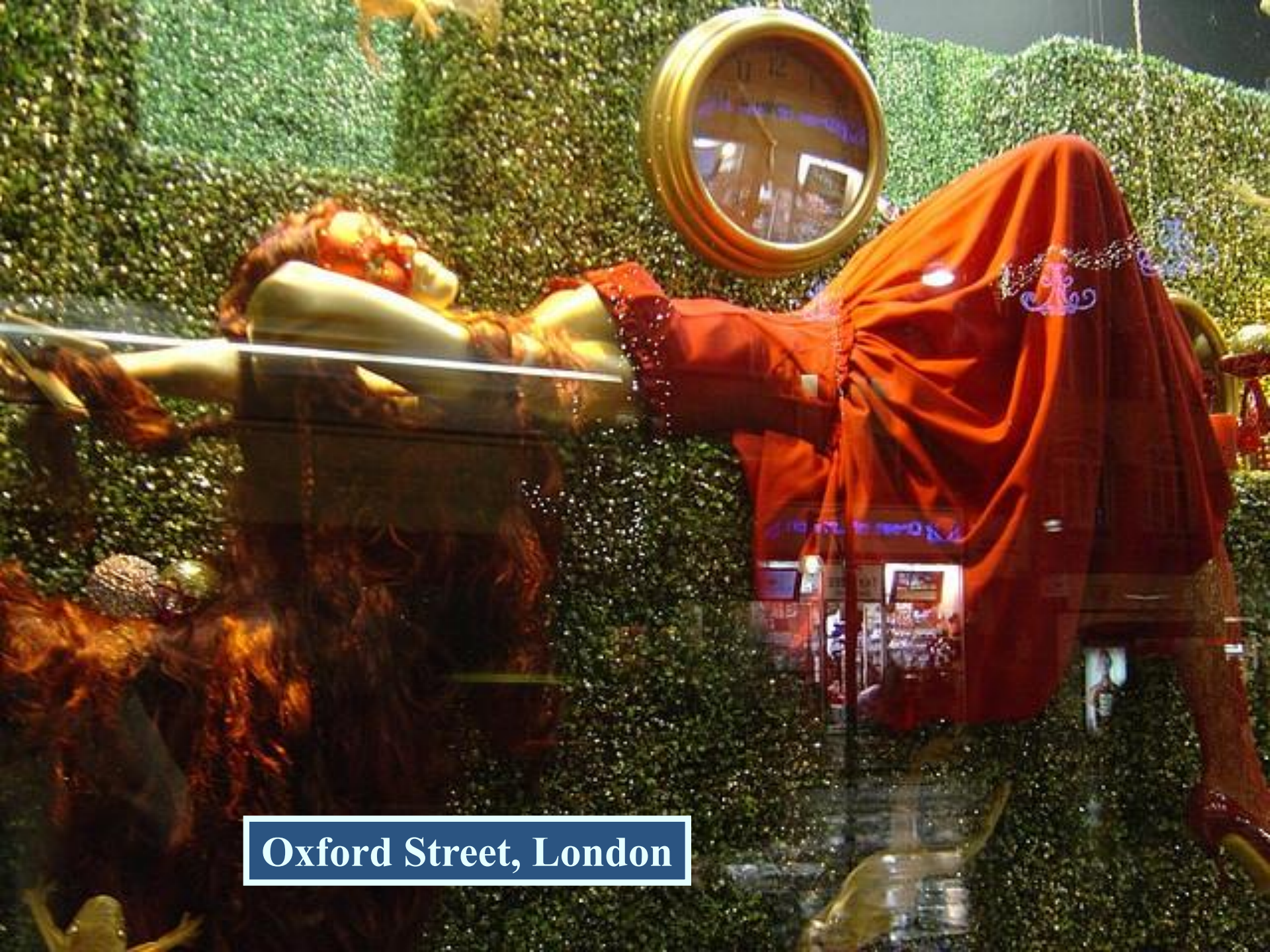
Oxford Street, London