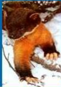
Куница - харза