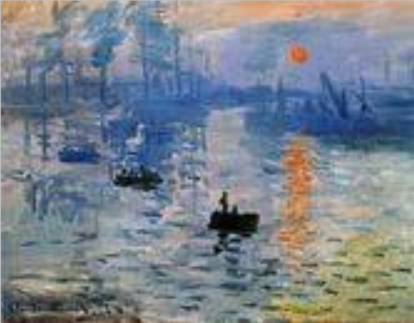
К.Моне «Впечатление. Восход солнца» (1872).