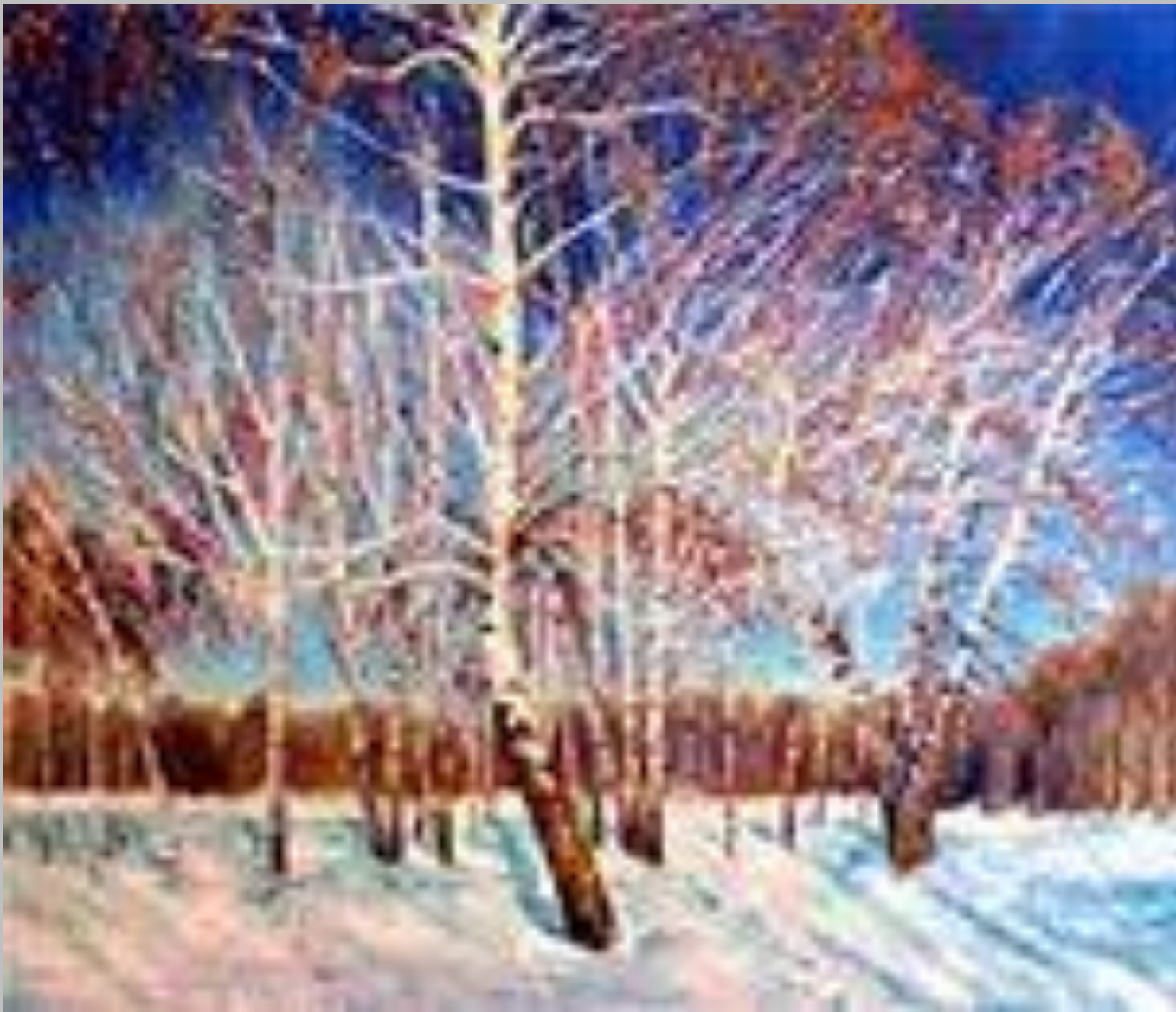
Картина Игоря Эммануиловича Грабаря «Февральская лазурь» 1904 г