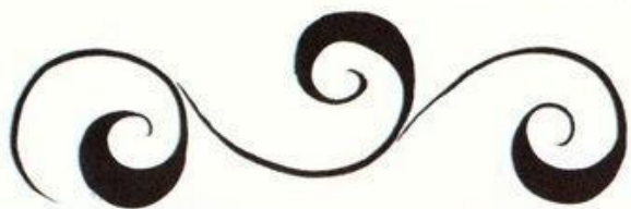
ВЕДУЩИЙ СТЕБЕЛЬ — «КРИ