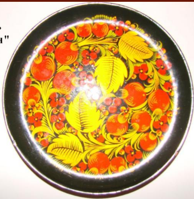
Роспись "под фон"