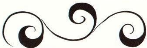
ВЕДУЩИЙ СТЕБЕЛЬ — «КРИВЫЙ»