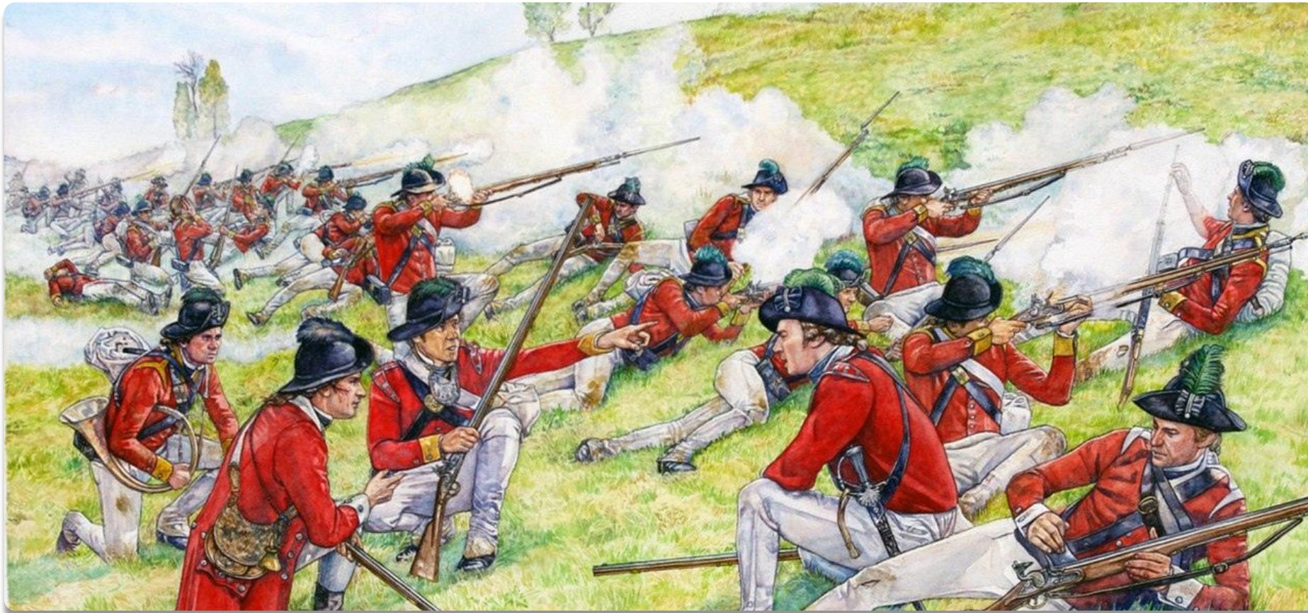
Битва при Брендивайне