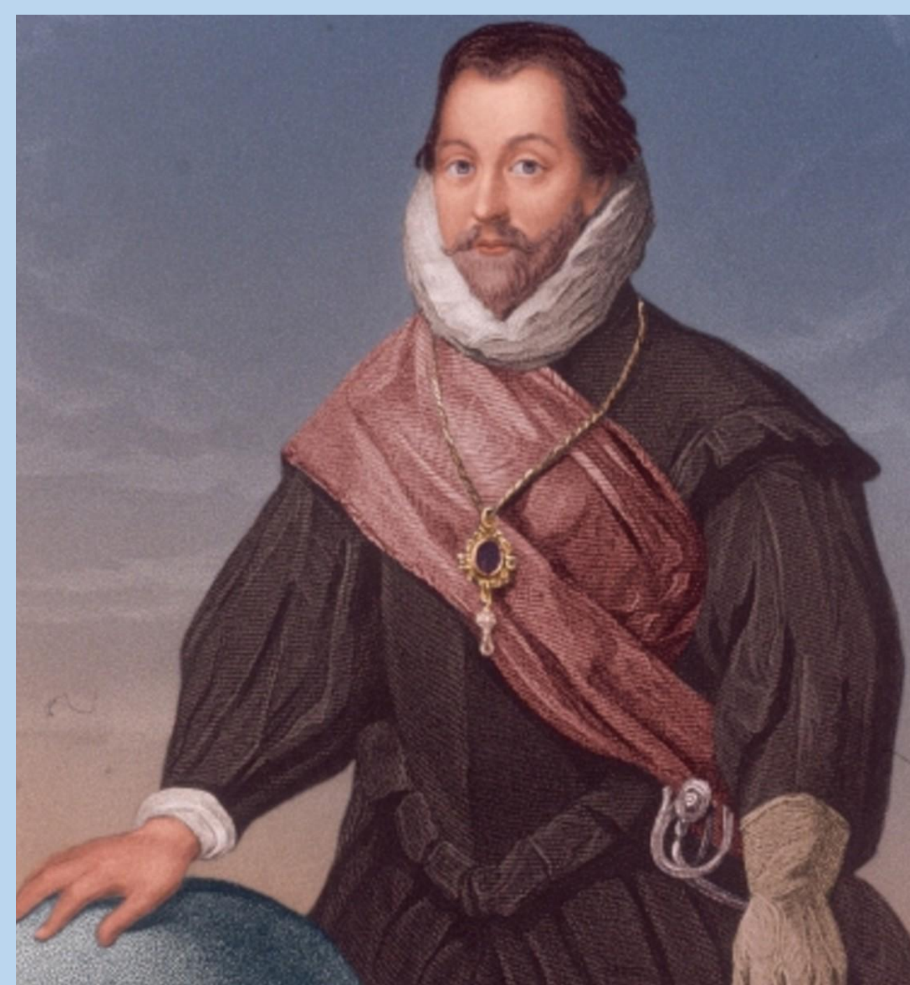
Френсис Дрейк 1540-1596