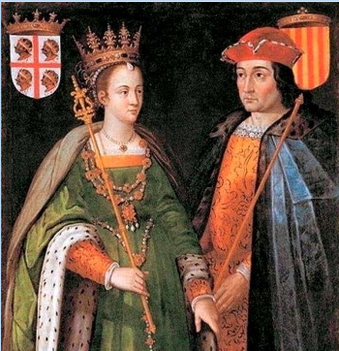
Фердинанд и Изабелла