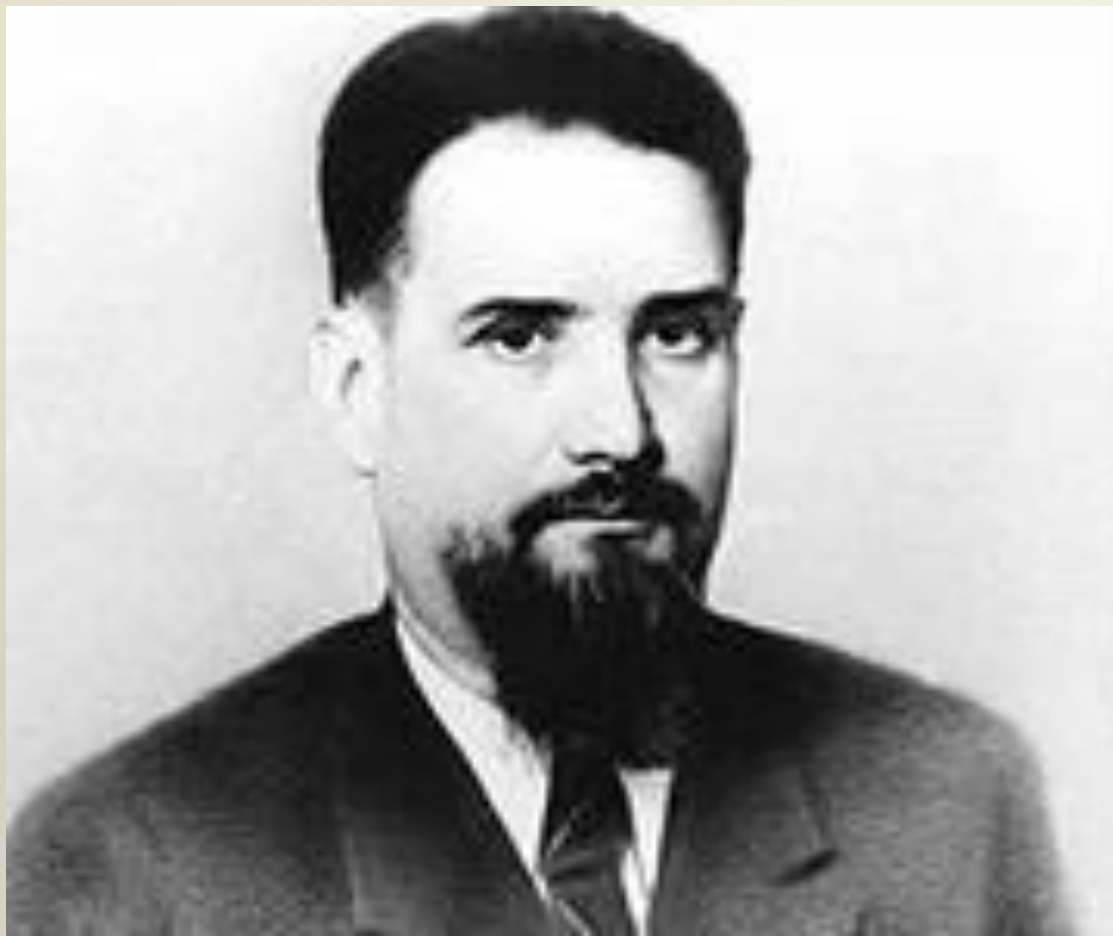
ИГОРЬ ВАСИЛЬЕВИЧ КУРЧАТОВ.