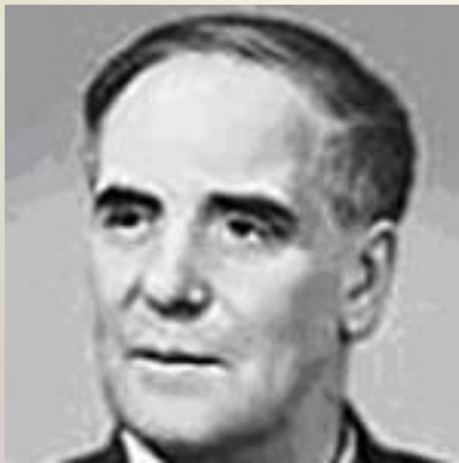
ПЁТР ЛЕОНИДОВИЧ КАПИ́ЦА