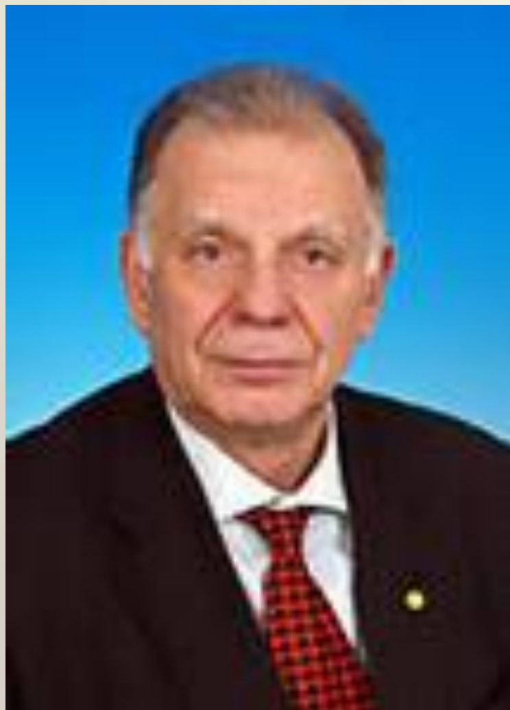
ЖОРЕС ИВАНОВИЧ АЛФЁРОВ