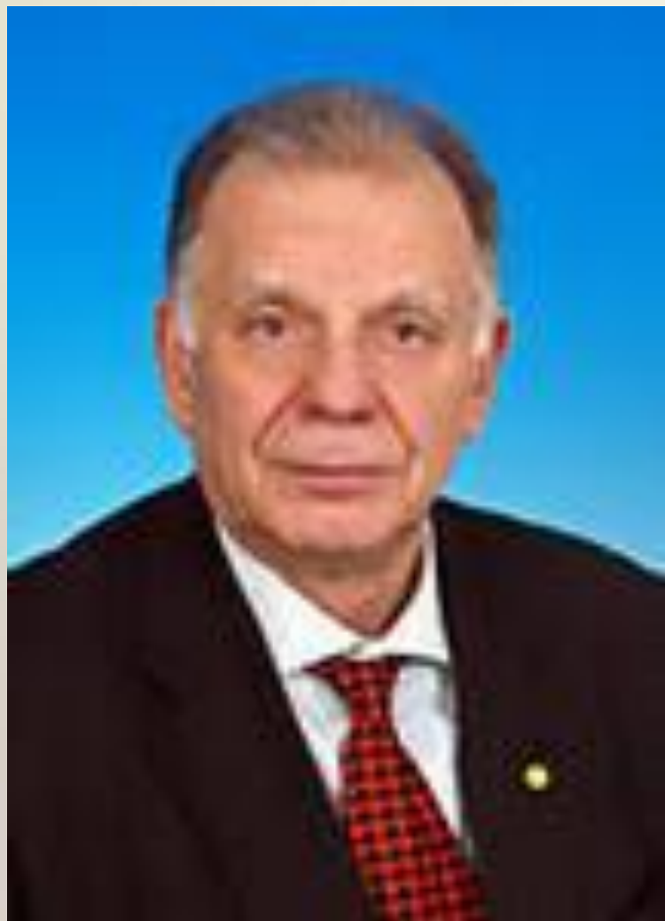
ЖОРЕС ИВАНОВИЧ АЛФЁРОВ