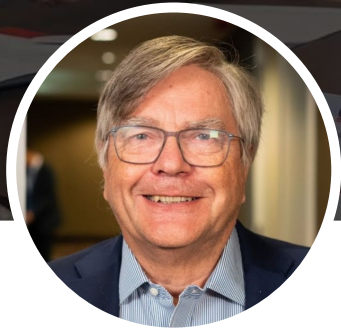
Матти ААПРО Швейцария Председатель совета директоров Евразийской федерации онкологии

III Евразийский семинар «Гематология для негематологов», 11 августа 2021 г.