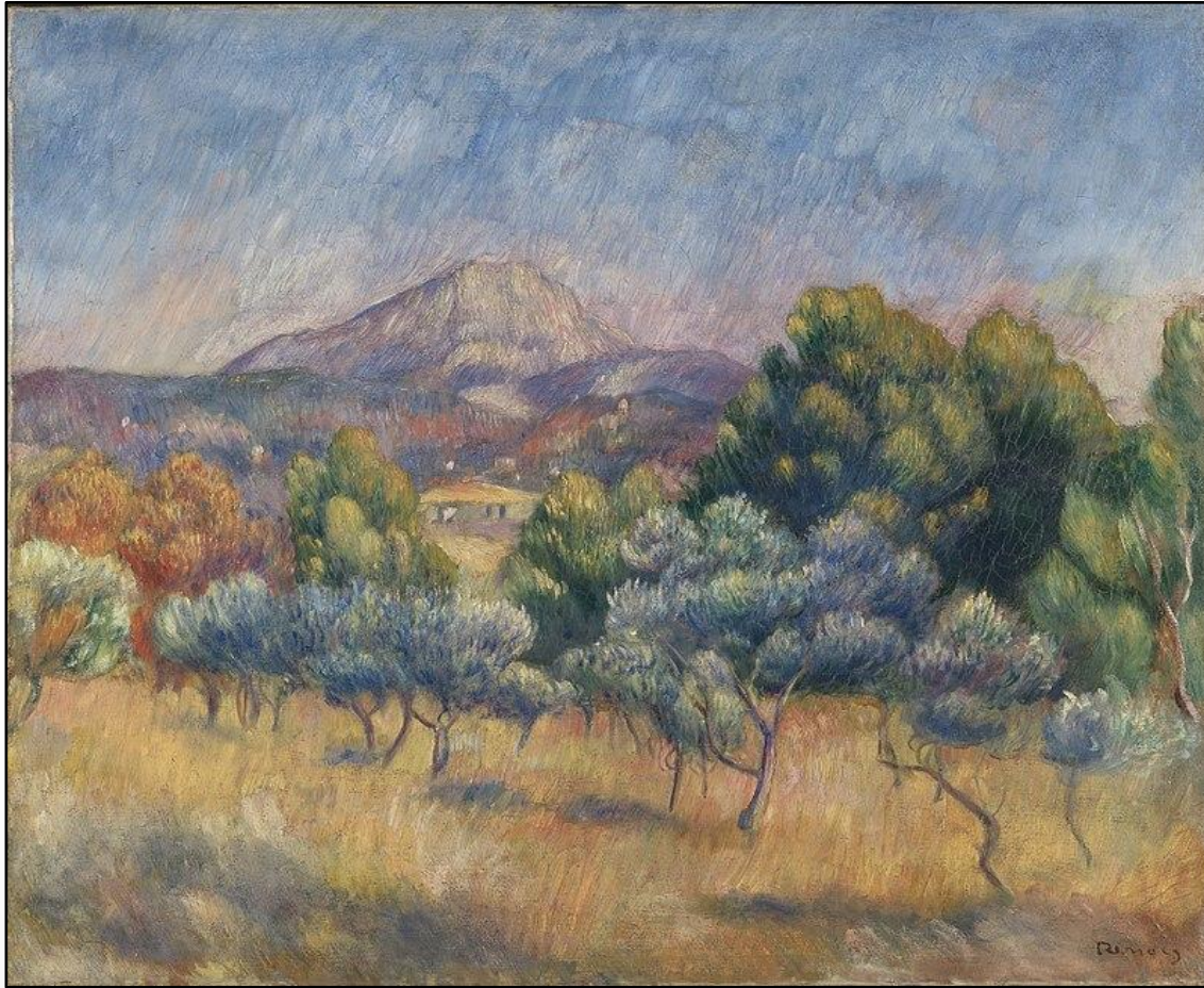
Пьер Огюст Ренуар, ок. 1888-89 гг. «Гора Сент-Виктуар», масло на холсте, Художественная галерея Йельского университета