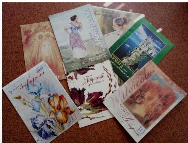
Бумага акварельная формат А3