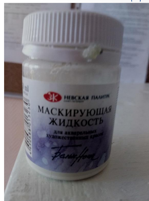
Маскирующая жидкость для акварели