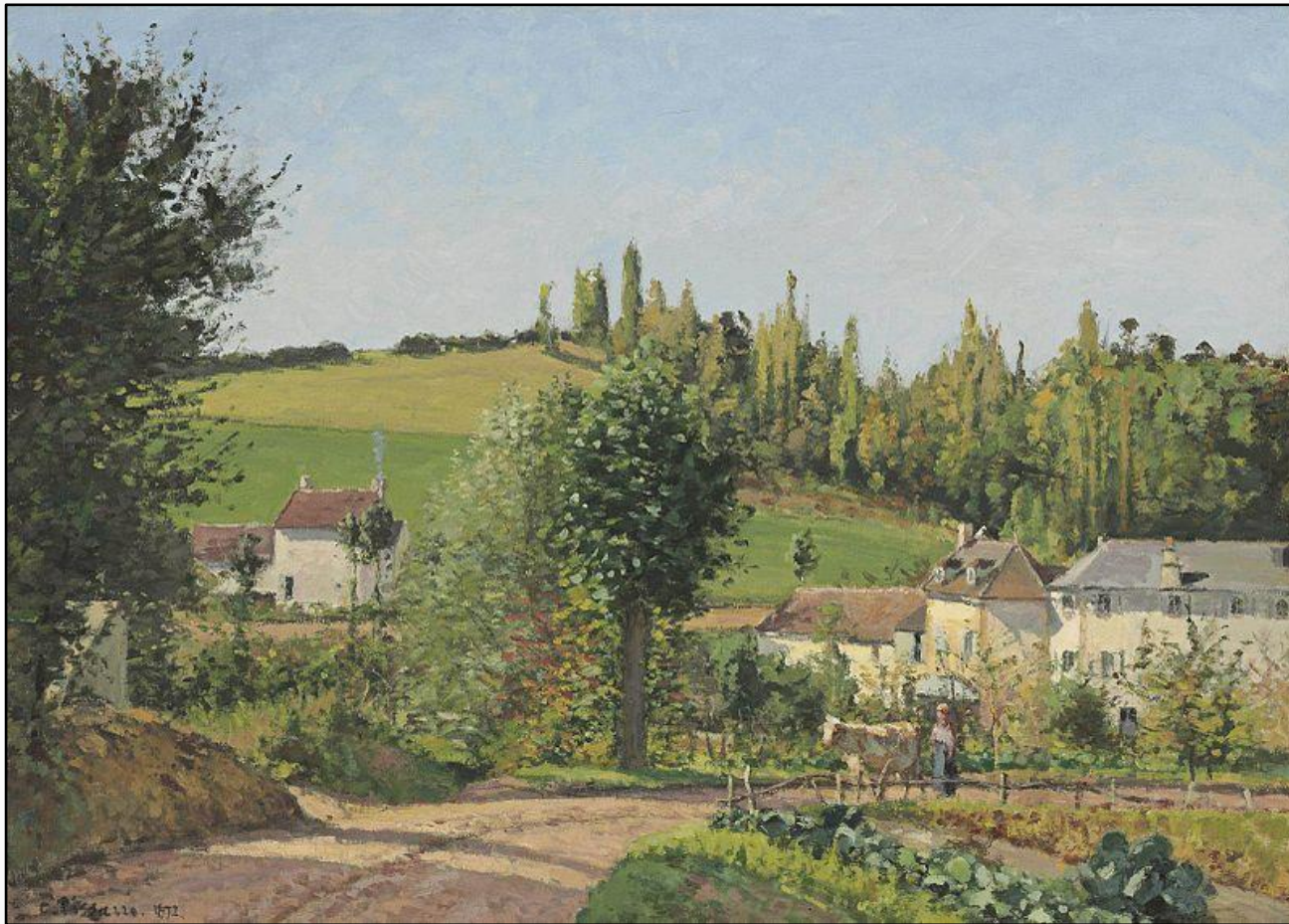
Камиль Писсарро , 1872 г., «Деревушка близ Понтуаза», масло на холсте, частная коллекция