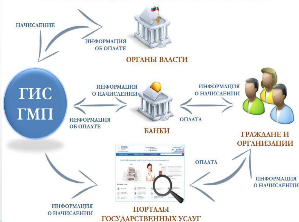
Схема информационного взаимодействия участников ГИС ГМП