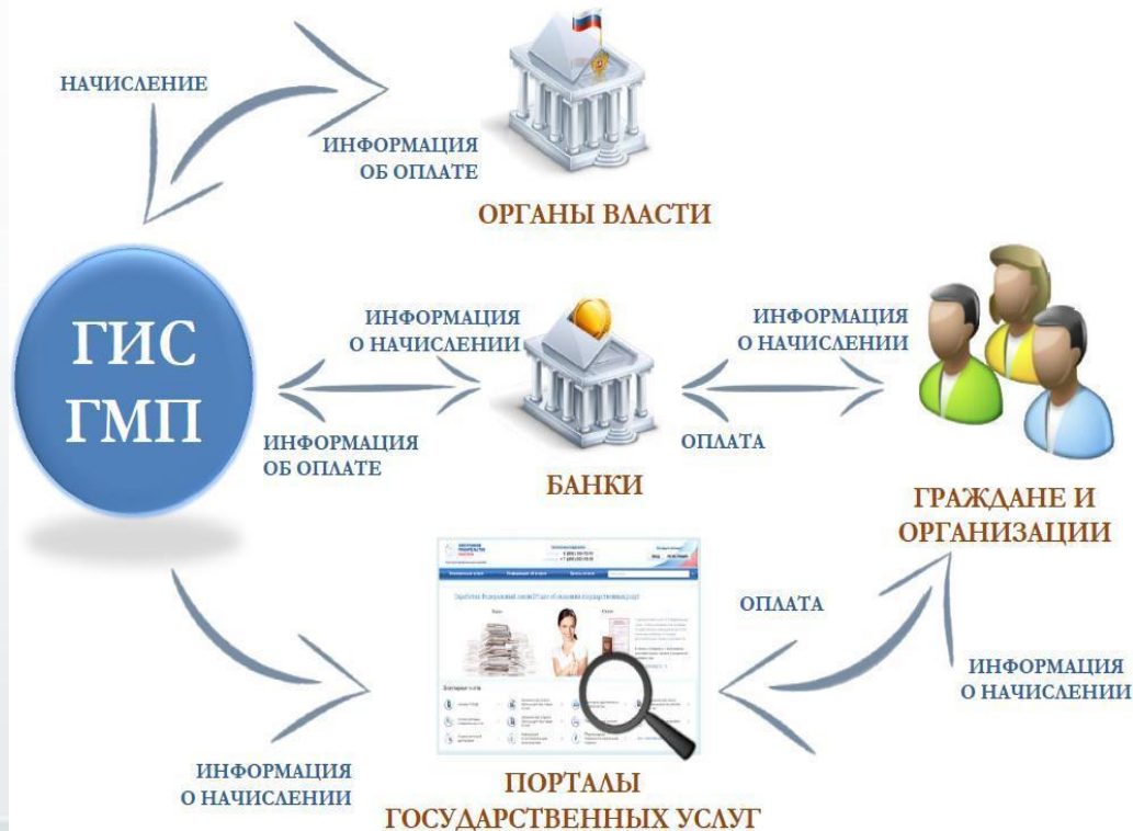
Схема информационного взаимодействия участников ГИС ГМП