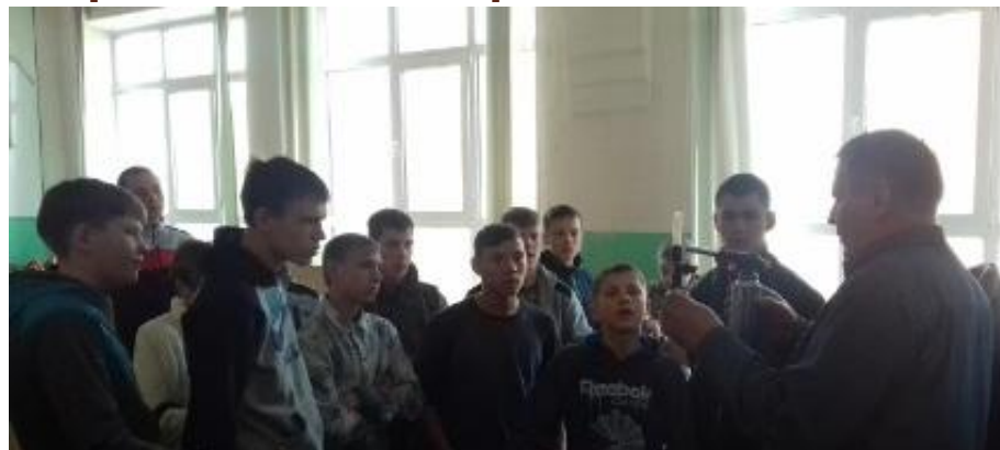
КГБ ПОУ «ХАБАРОВСКИЙ ТЕХНИКУМ ГОРОДСКОЙ ИНФРАСТРУКТУРЫ И ПРОМЫШЛЕННОГО ПРОИЗВОДСТВА»

7. Хабаровский техникум инфраструктуры и промышленного производства - слесарь-сантехник