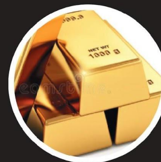
24-Х КАРАТНОЕ ЗОЛОТО