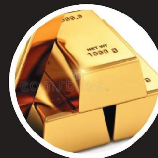
24-Х КАРАТНОЕ ЗОЛОТО