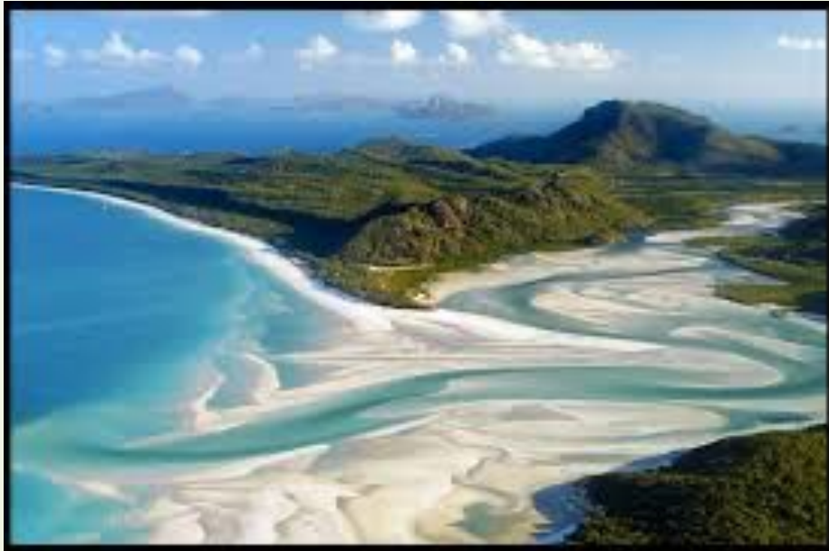
Пляж 'Белая гавань'