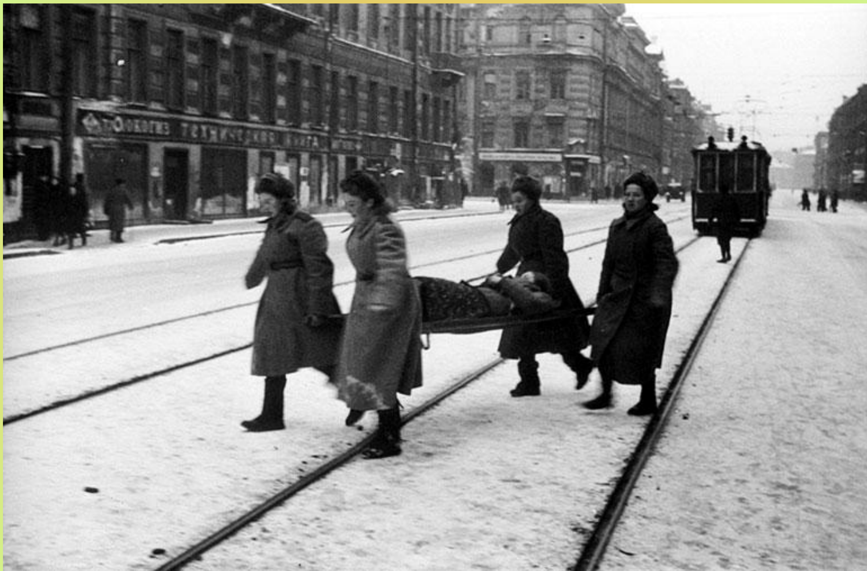
Декабрь 1943 г. Место съёмки: г. Ленинград