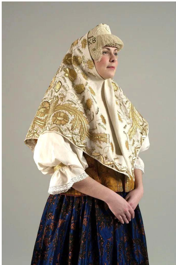
Женский праздничный костюм Каргопольский уезд.