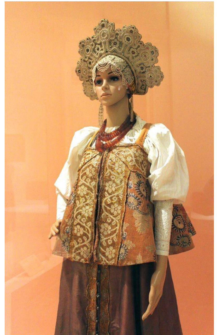
Костюм пинежской невесты