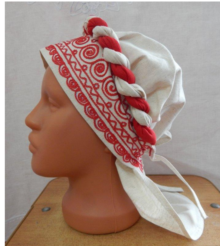
Современная косынка на голову