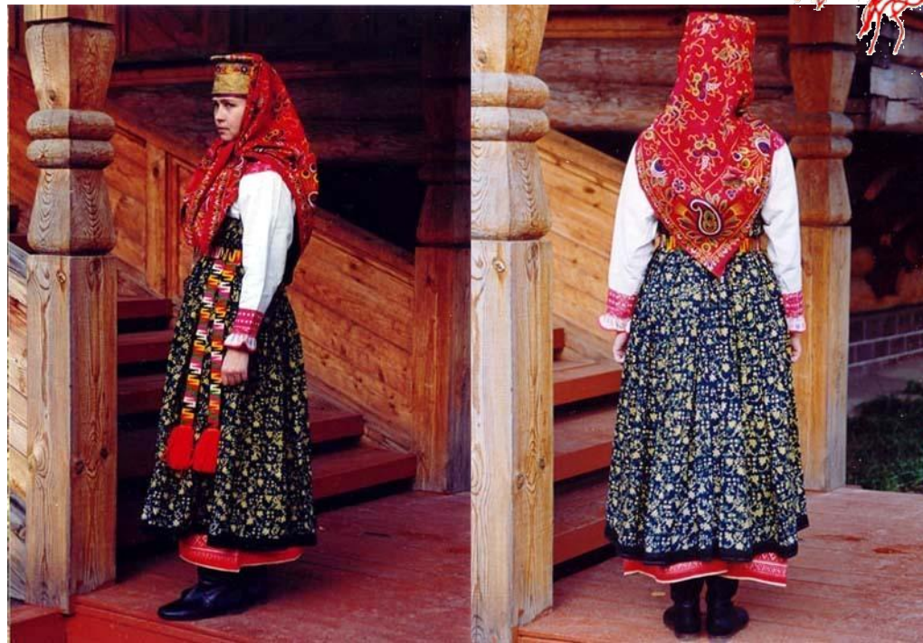
Традиционный костюм поморов. Архангельская губерния