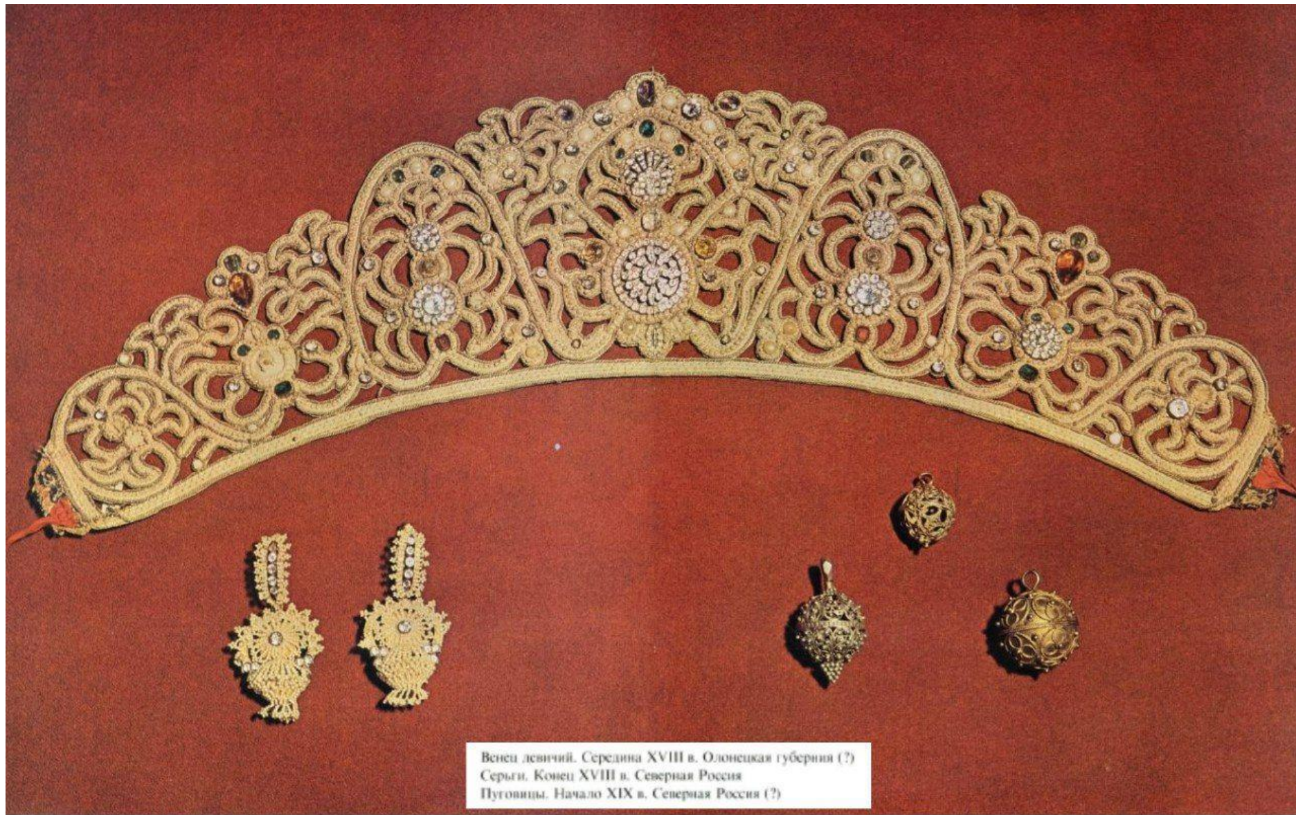
Венец девичий. Середина XVIII в. Олонецкая губерния (?) Серьги. Конец XVIII в. Северная Россия Пуговицы. Начало XIX в. Северная Россия (?)