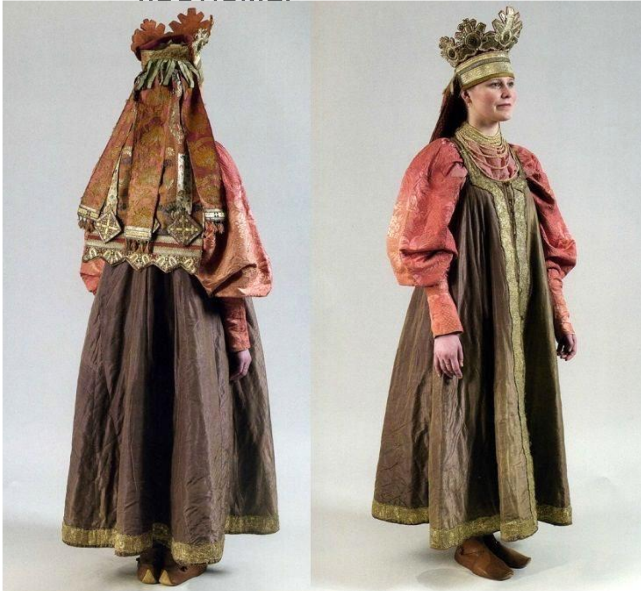
Свадебный костюм Шенкурский уезд