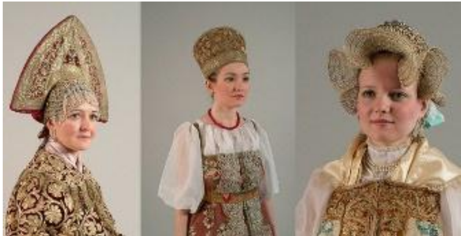
Кокошник Архангельская губерния. Речной жемчуг, перламутр