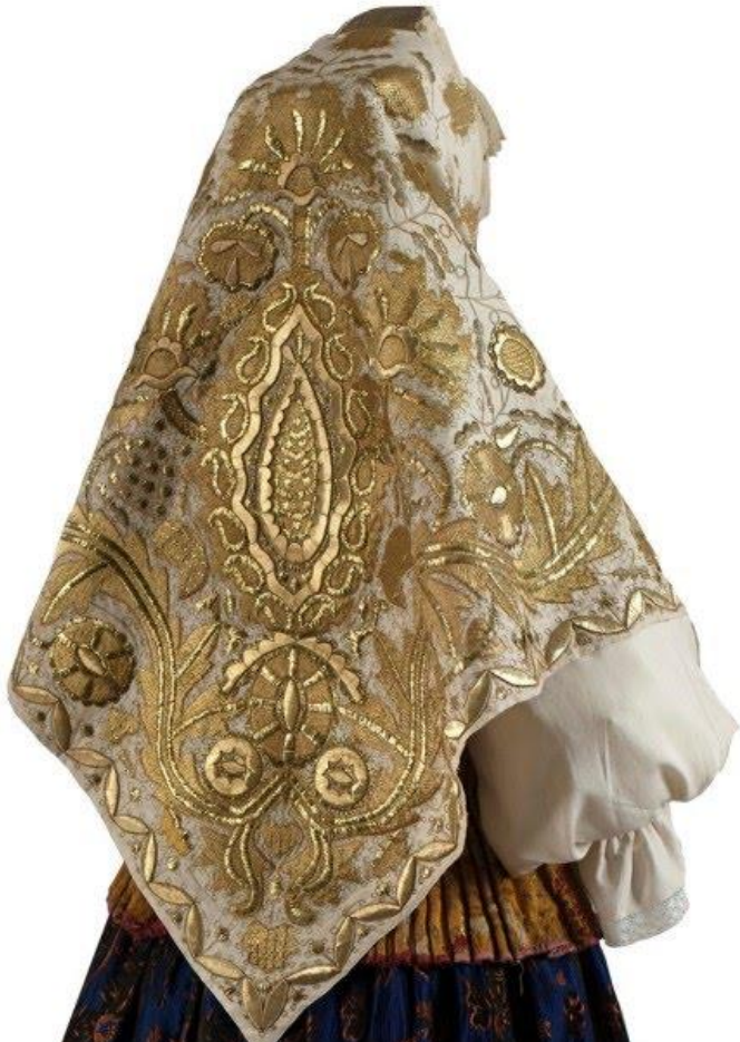
Каргопольский платок. Вторая половина XIX века.