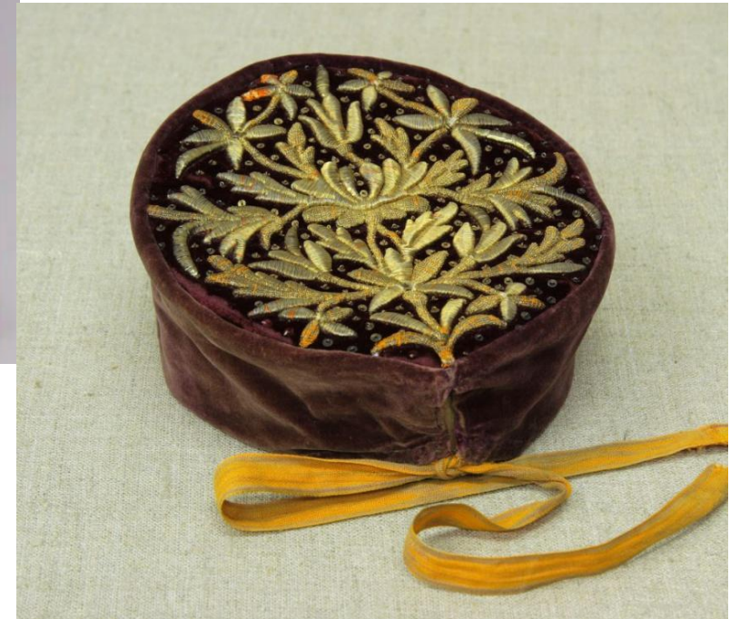
Повойник Мезенского уезда Архангельской облсасти