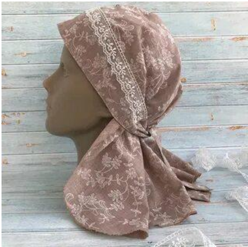
Косынка на голову