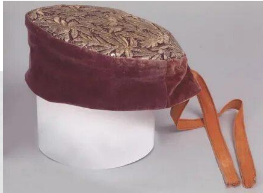
Повойник поморской замужней женщины

Повойник. Шапочка с мягким ничем не украшенным околышком и бархатным или шелковым доньшком, ушитым вписанными в круг золотными узорами или бисерной вышивкой.