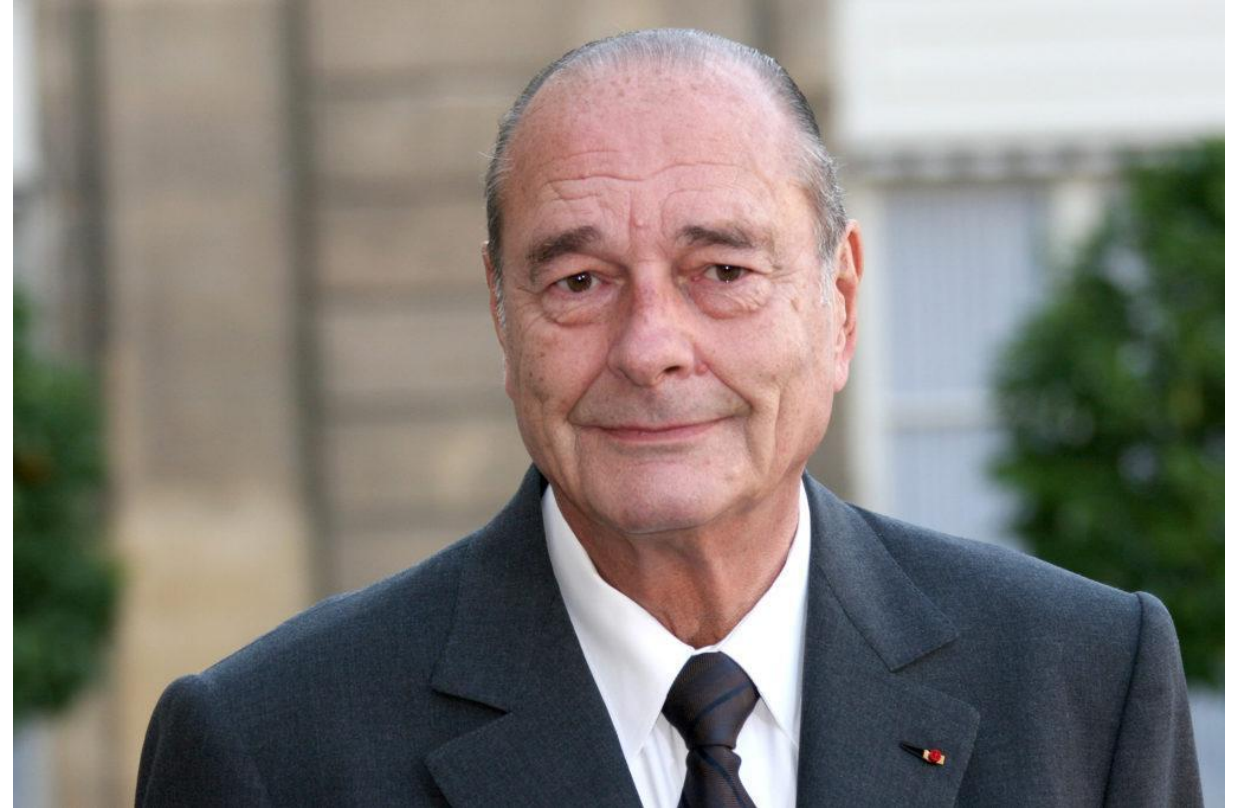
22-й президент Франции Жак Ширак

В 1995 году Жак Ширак выдвинул свою кандидатуру на президентских выборах от партии ОЛР. Был избран президентом Франции. Заняв пост президента, он сосредоточил главные усилия своего правительства на борьбе с инфляцией и бюджетным дефицитом путем сокращения государственных расходов и социальных пособий.