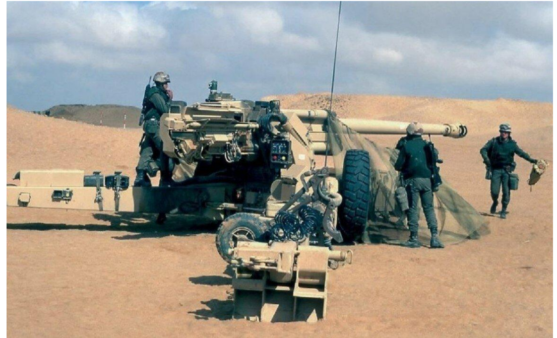
Французская артиллерия в военной операции

Подобная кампания стала самой масштабной в истории французской армии операцией за последние тридцать лет. Эти навыки участия французов в боях вошли во многие учебные материалы, которые изучаются во время подготовки курсантов. Каждый год в Париже отмечается участие Франции в войне с Ираком, а представители дивизии «Даге» получают правительственные награды из рук президентов страны.