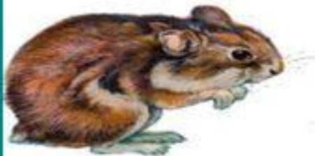
Джунгарский хомячок (до 10 см)