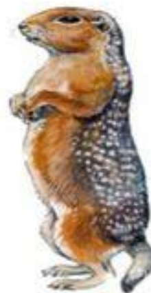
Суслик (до 26 см)