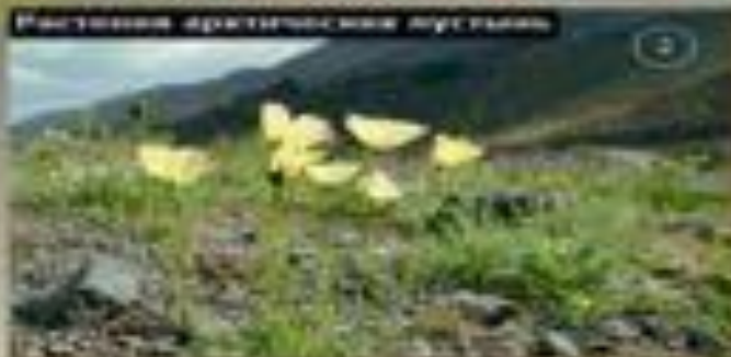
Растения арктических пустынь