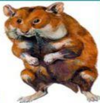
Хомяк обыкновенный (до 32 см)