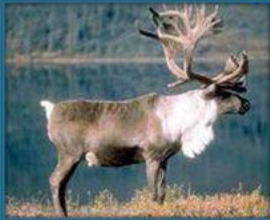
СЕВЕРНЫЙ ОЛЕНЬ (КАРИБУ)

С началом зимы лемминги покидают свои норы в земле и переходят к жизни под снегом