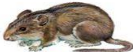
Полевая мышь (до 12 см)