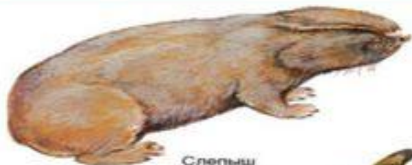
Слепыш (до 26 см)