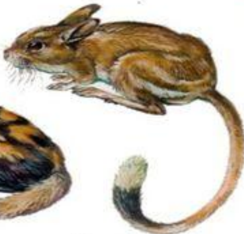
Большой тушканчик (до 26 см)