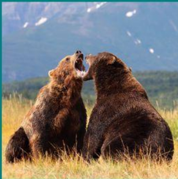
Бурый медведь (хозяин тайги)

Многочисленны и широко распространены: бурый медведь, рысь, росомаха, бурундук, куница, соболь, белка и др.