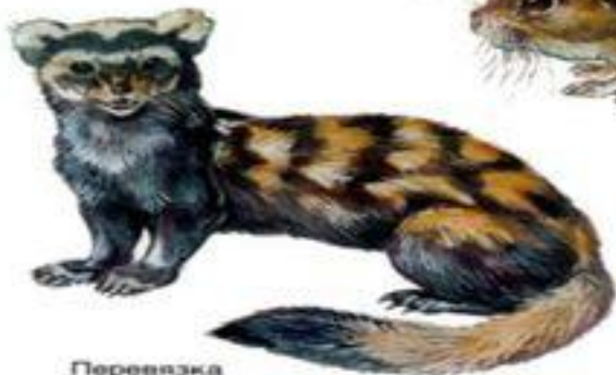
Перевязка (до 35 см)