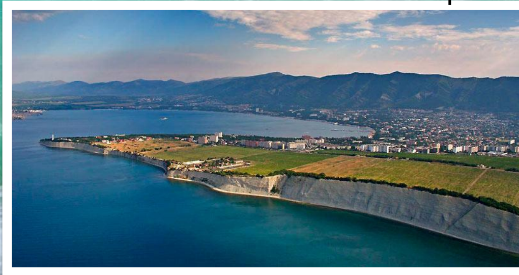
Черноморское побережье Краснодарского края