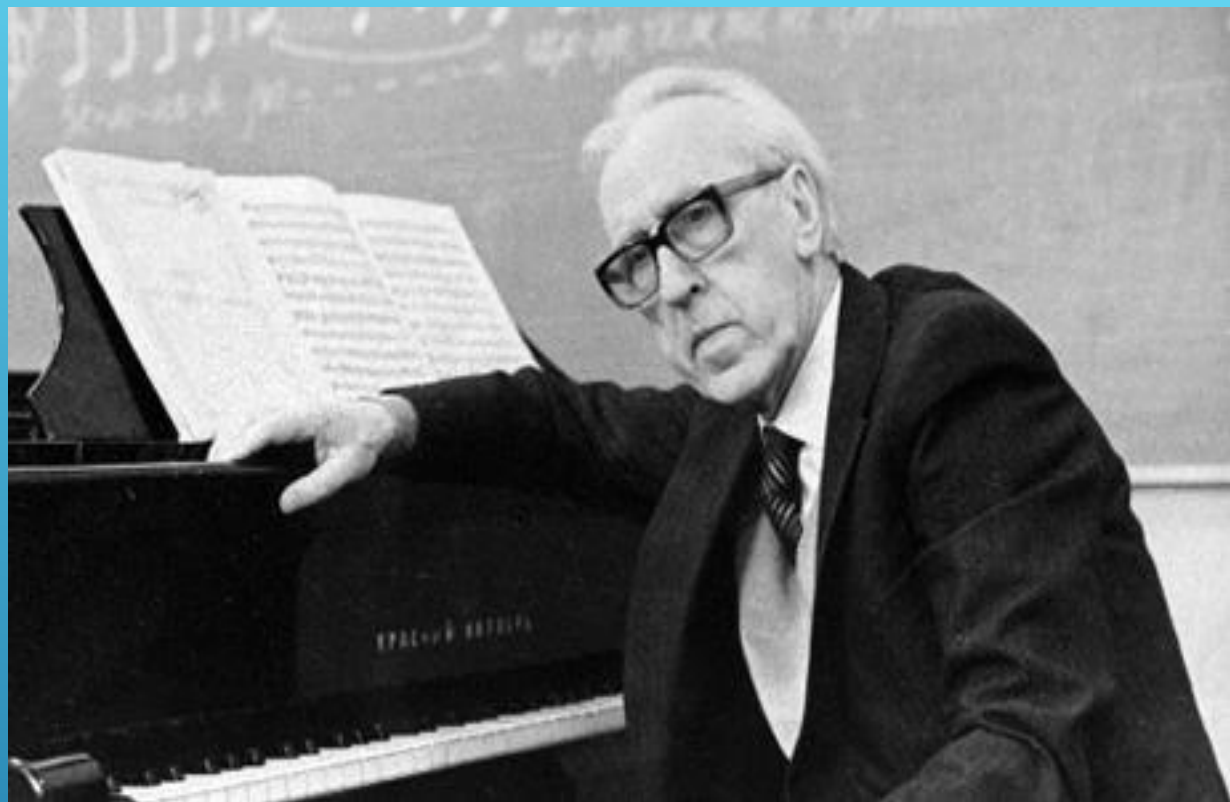
Д. Б. КАБАЛЕВСКИЙ