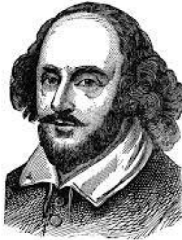
William Shakespeare Playwright and poet 1564-1616