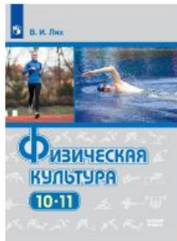
Физическая культура. 10-11 классы. Электронная форма учебника