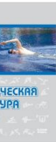
Физическая культура. 10-11