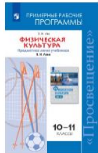
Физическая культура. Рабочие программы. Предметная линия учебников В. И. Ляха.10-11 классы