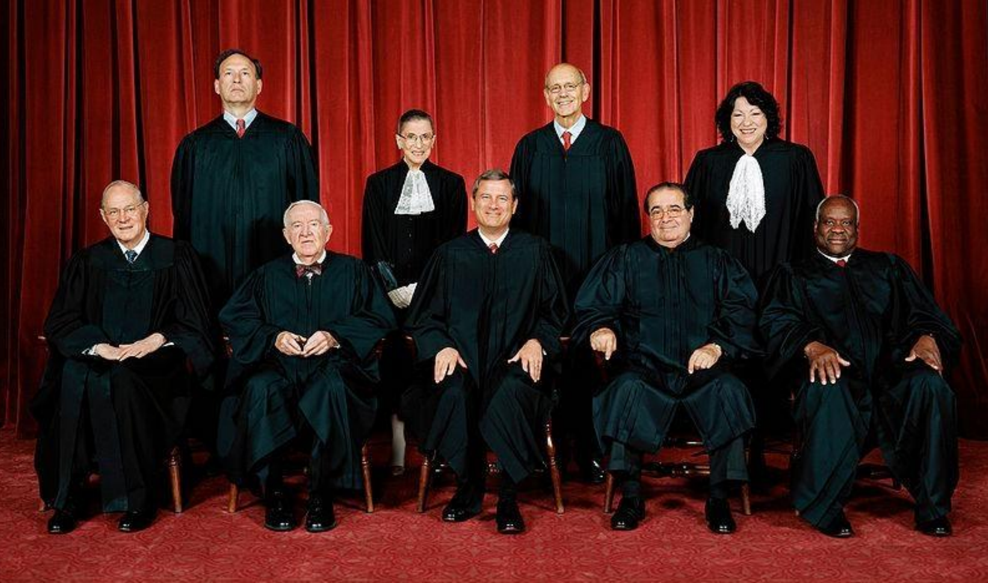
Члены Верховного суда США.