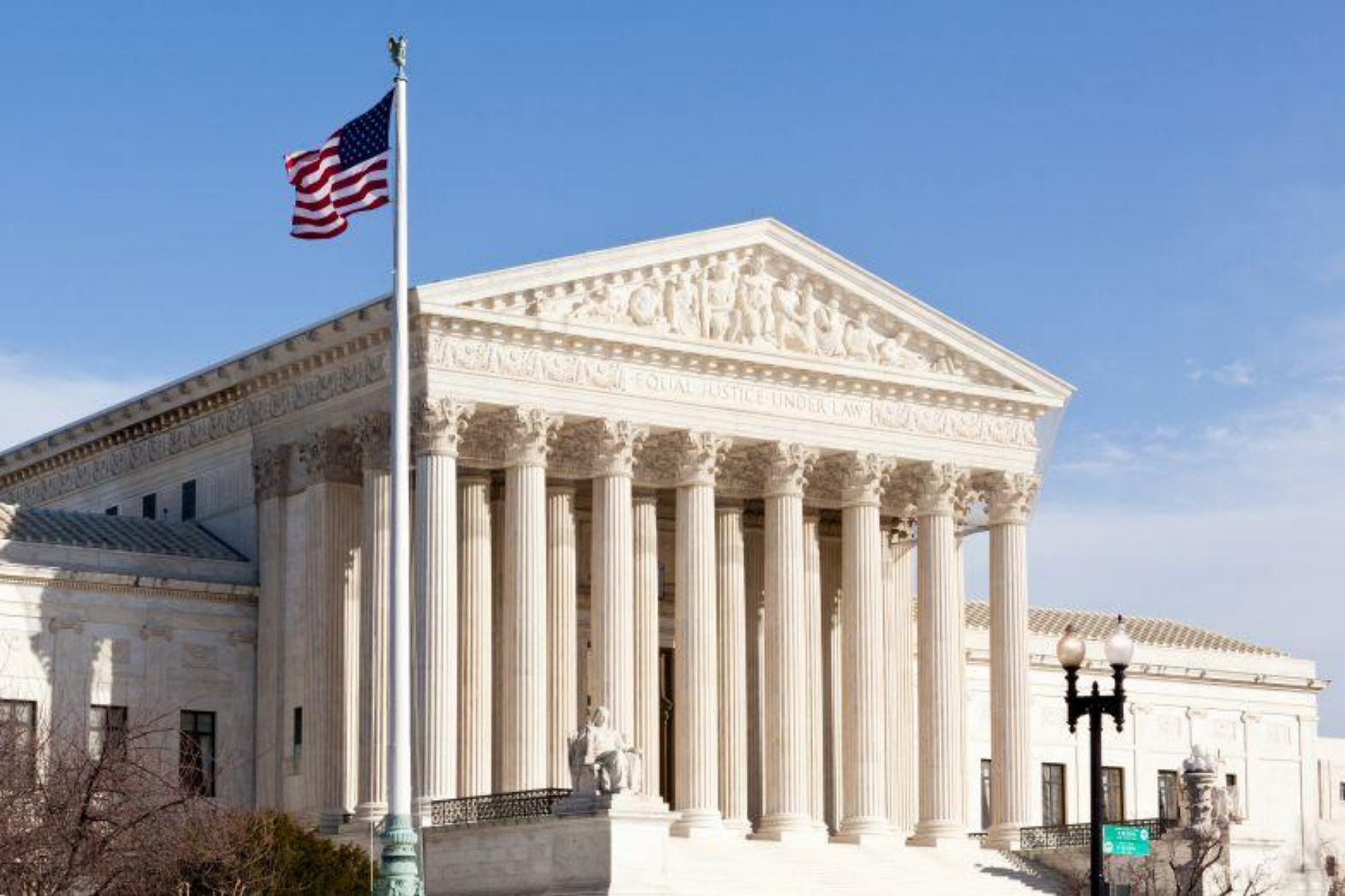
Верховный суд США, Вашингтон.