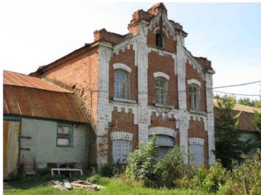
Дом управляющего с каретным двором