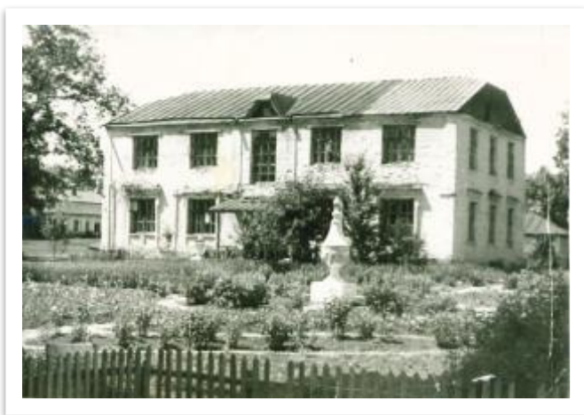
Бывшая людская с надстроенным 2-м этажом, 60-е годы 20 века