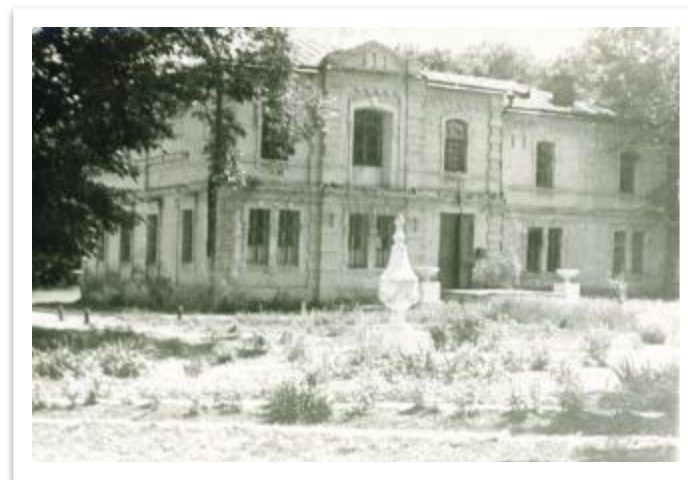
Барский дом с гостиной Е. У. Ланской в советское время, 60-е годы 20 века