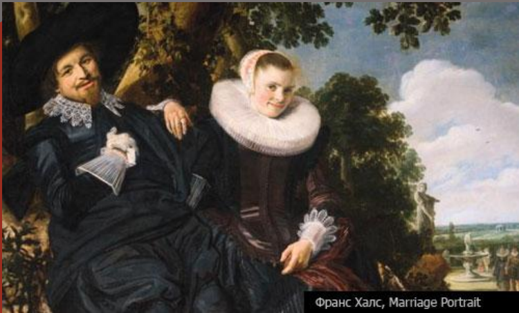
Франс Халс, Marriage Portrait