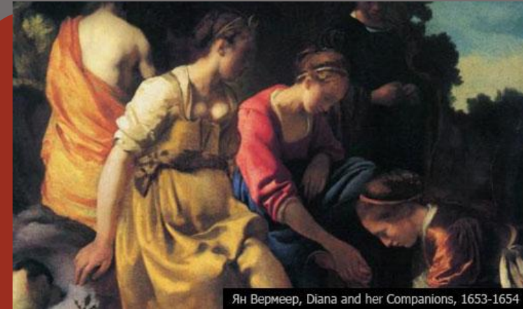
Ян Вермеер, Diana and her Companions, 1653-1654