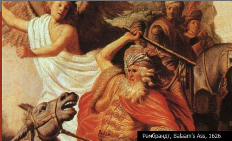
Рембрандт, Balaam's Ass, 1626