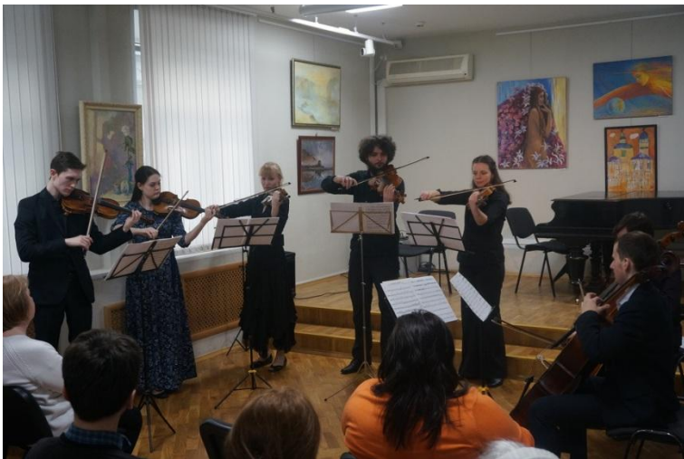
Культурный центр им. А.П.Чехова