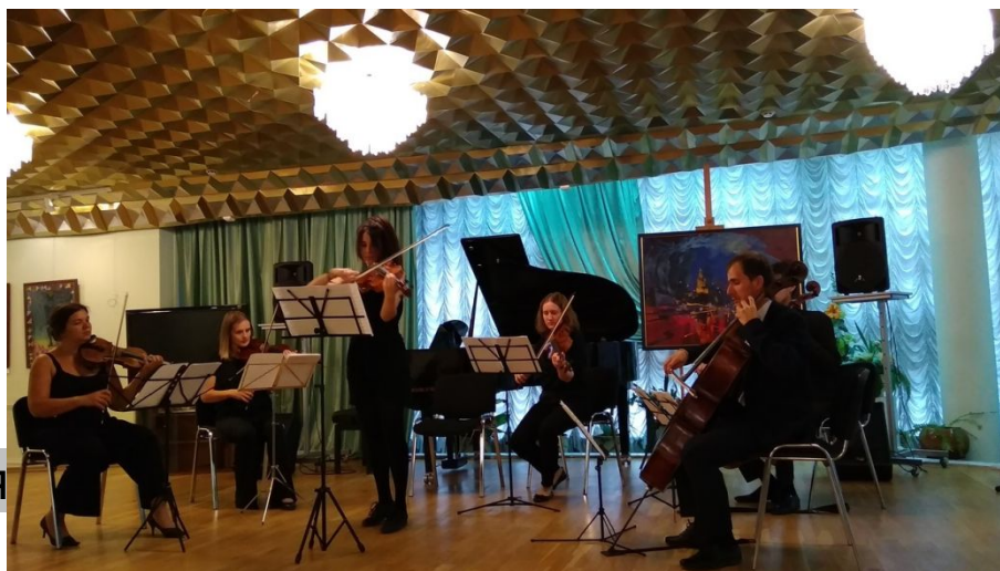
Выставочный зал «Тушино»