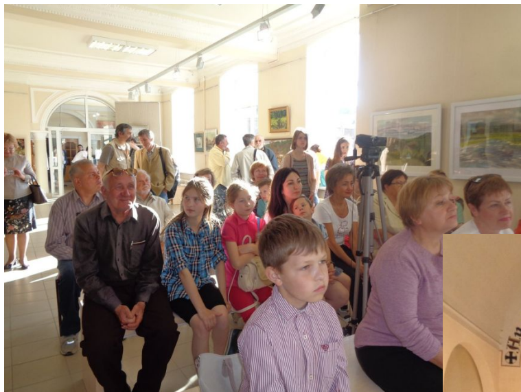
Псков, 2018 год