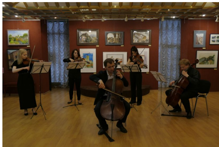
Выставочный зал «Тушино»