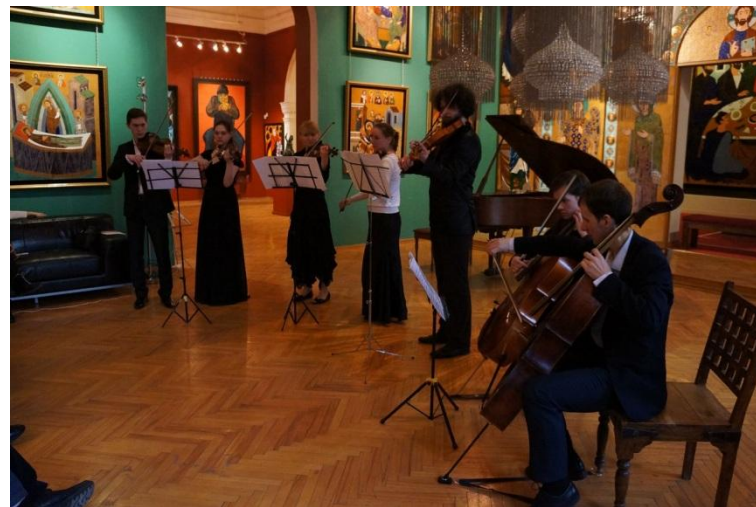
Галерея искусств З.Церетели