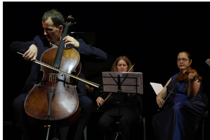
Культурный центр «Щукино»