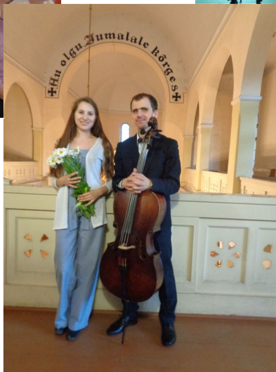
Печоры, 2019 год