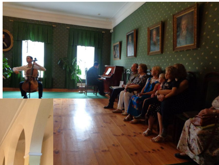
Тригорское, 2017 год