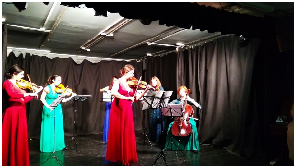
Культурный центр «Феникс»