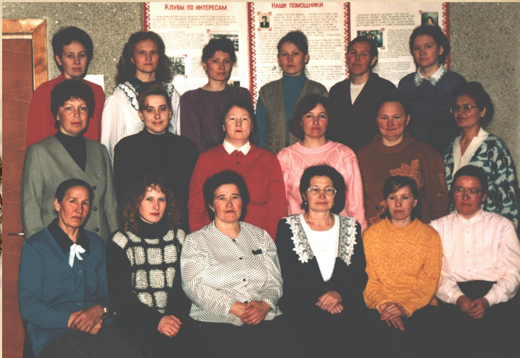
Работники Советской ЦБС