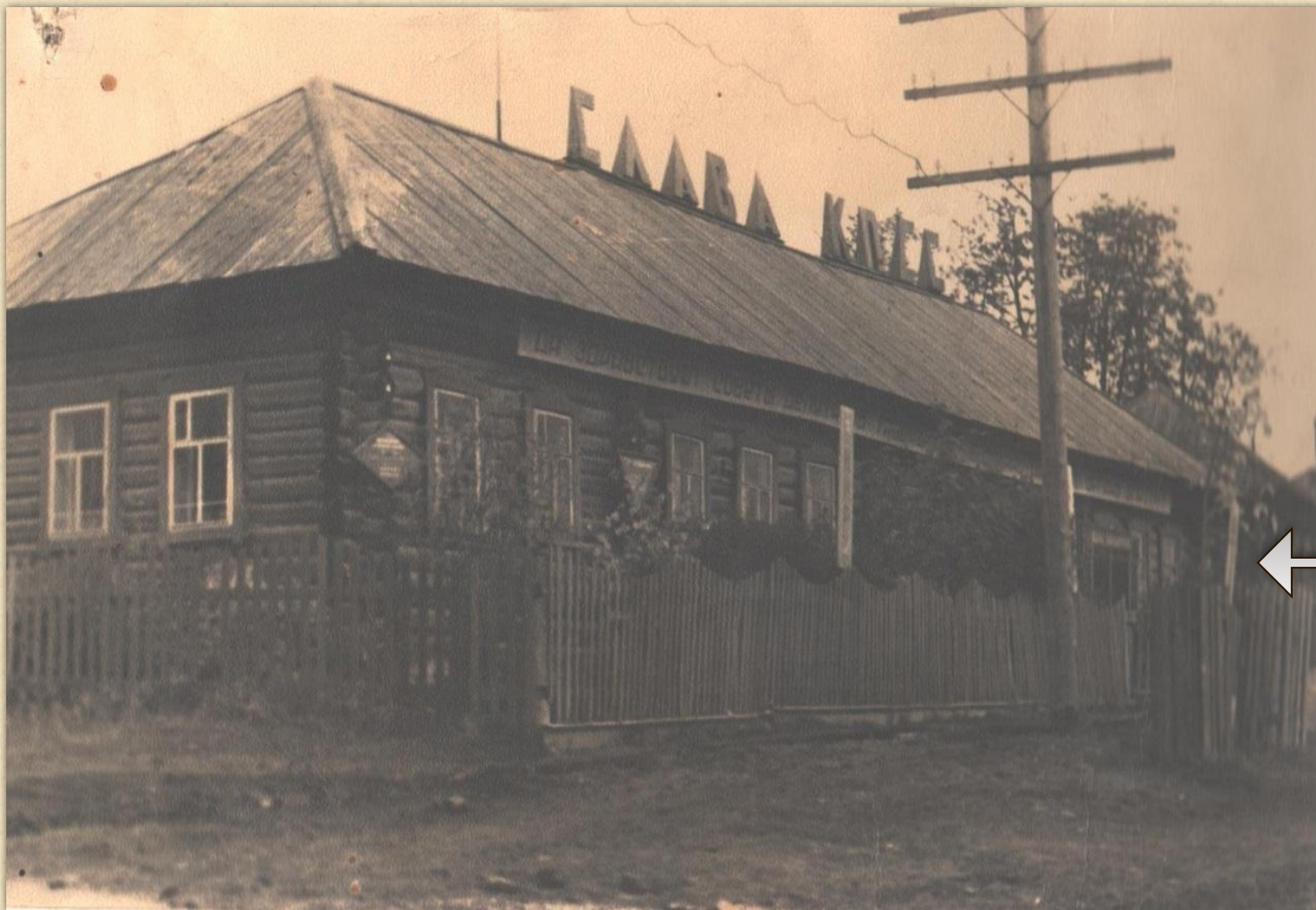
Ронгинская сельская библиотека (1964 – 1986 г.г. правое крыло)