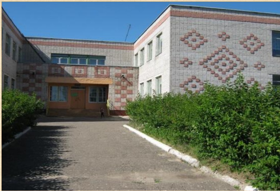
Детский сад «Колосок»