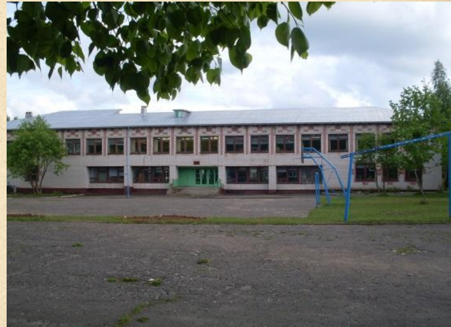
Ронгинская средняя общеобразовательная школа