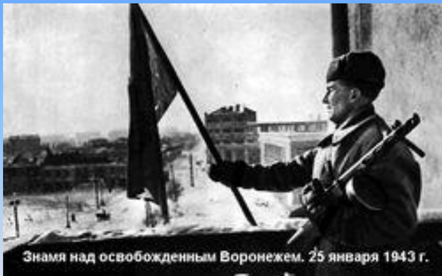
Знамя над освобожденным Воронежем. 25 января 1943 г.