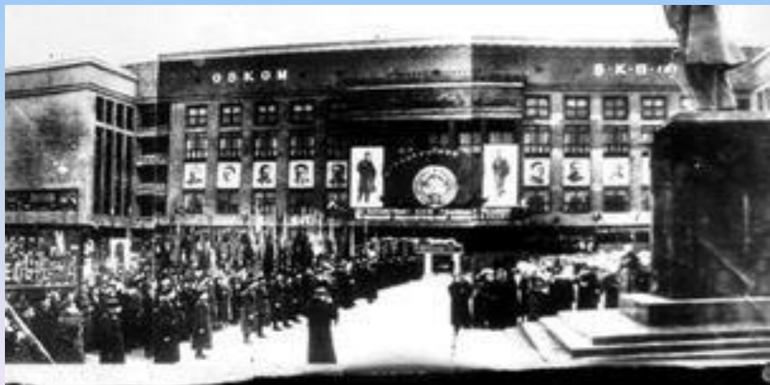
Парад 7 ноября 1941г..png