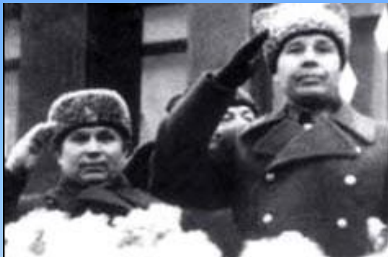
Парад 1941г. принимал маршал Н.К. Тимошенко. (позади - Н.С. Хрущёв)