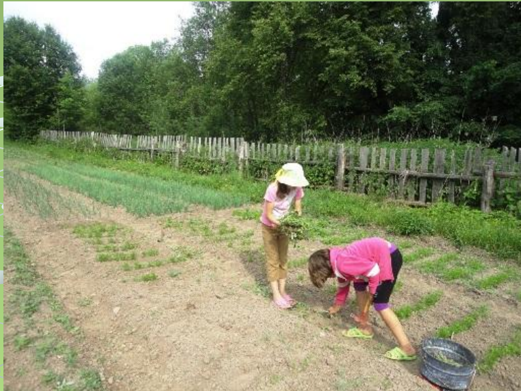
Прополка цветника и овощного отдела