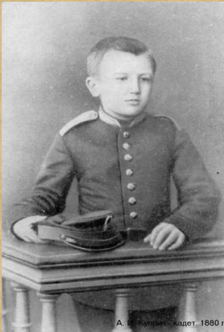
А. М. Куприн - кадет. 1880 г