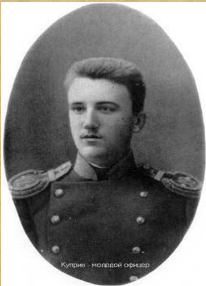
Куприн - молодой офицер

Осенью 1888 года Куприн поступил в Третье Александровское юнкерское училище в Москве.