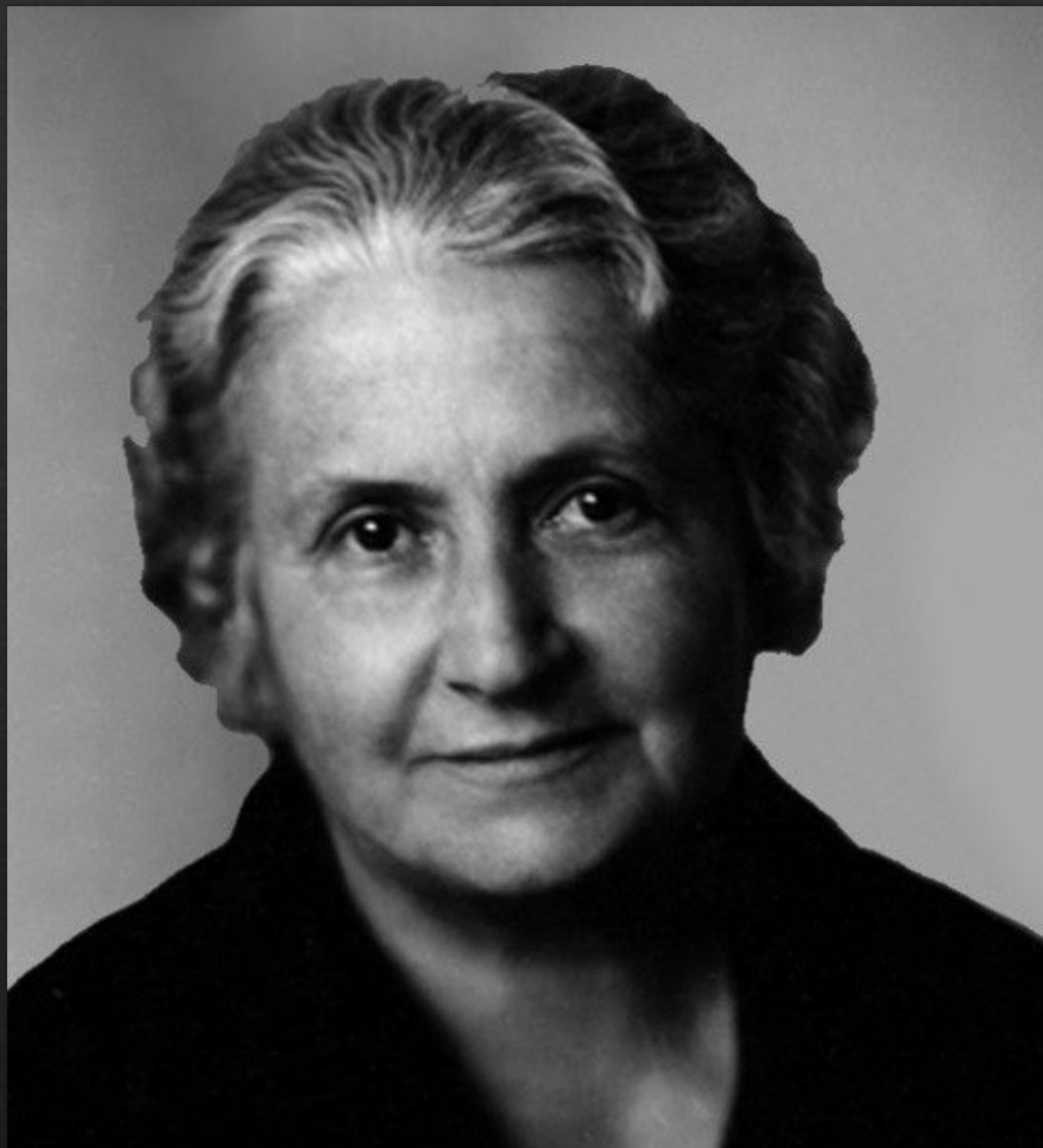
Мария Монтессори (31.08.1870 - 6.05.1952)