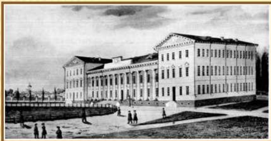
Здание гимназии высших наук в Нежине,

где в 1821-1828 гг. учился Н.В.Гоголь. «Еще бывши в школе, чувствовал я временами расположение к веселости и надоедал товарищам неуместными шутками. Но это были временные припадки; вообще же я был характера скорей меланхолического и склонного к размышлению».