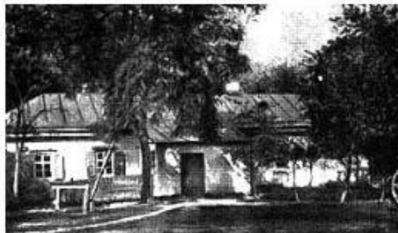
Дом где родился Гоголь

Николай Васильевич Гоголь родился 20 марта (1 апреля) 1809 года в селе Большие Сорочинцы, на границе Полтавского и Миргородского уездов. Николаем его назвали в честь чудотворной иконы Святого Николая. Согласно семейному преданию он происходил из старинного украинского казацкого рода и был потомком известного казака Остапа Гоголя, бывшего в конце XVII века гетманом Правобережной Украины. Детские годы Гоголь провел в имении родителей Васильевке.