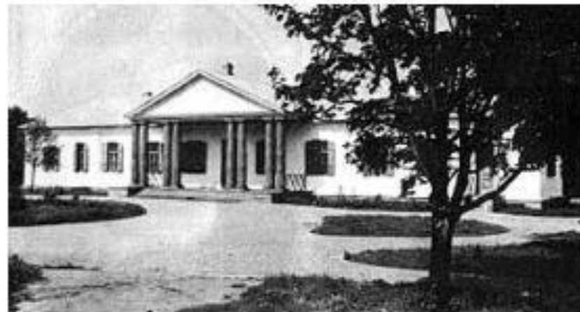
Родительский дом в Васильевке