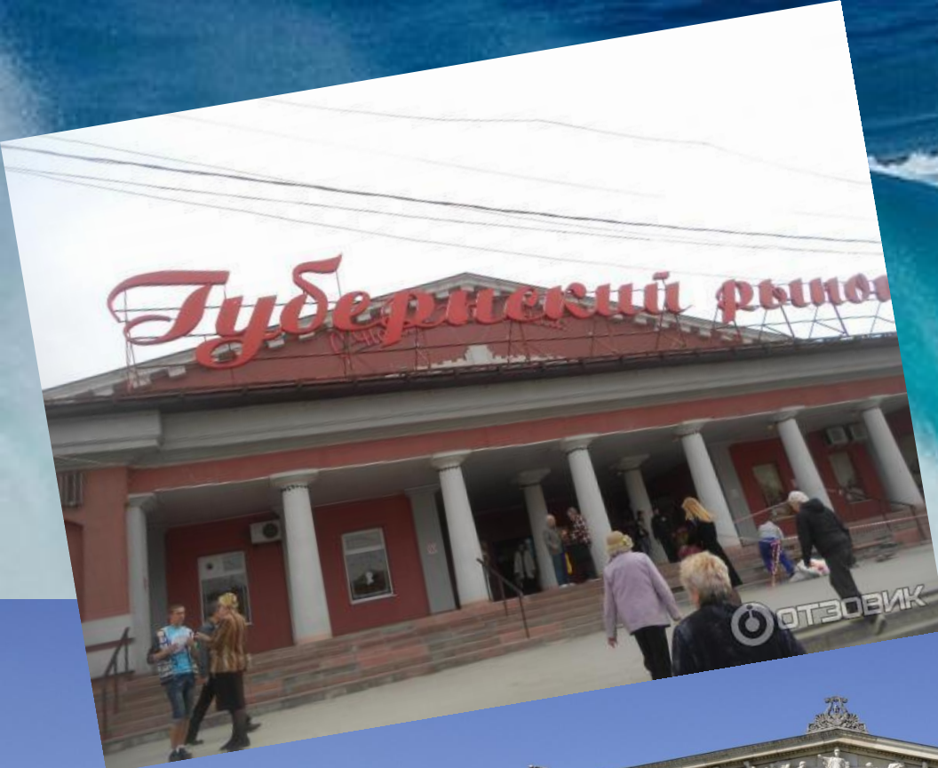
Der Gouvernementsmarkt (Samara, Agibalova Strasse, 19)