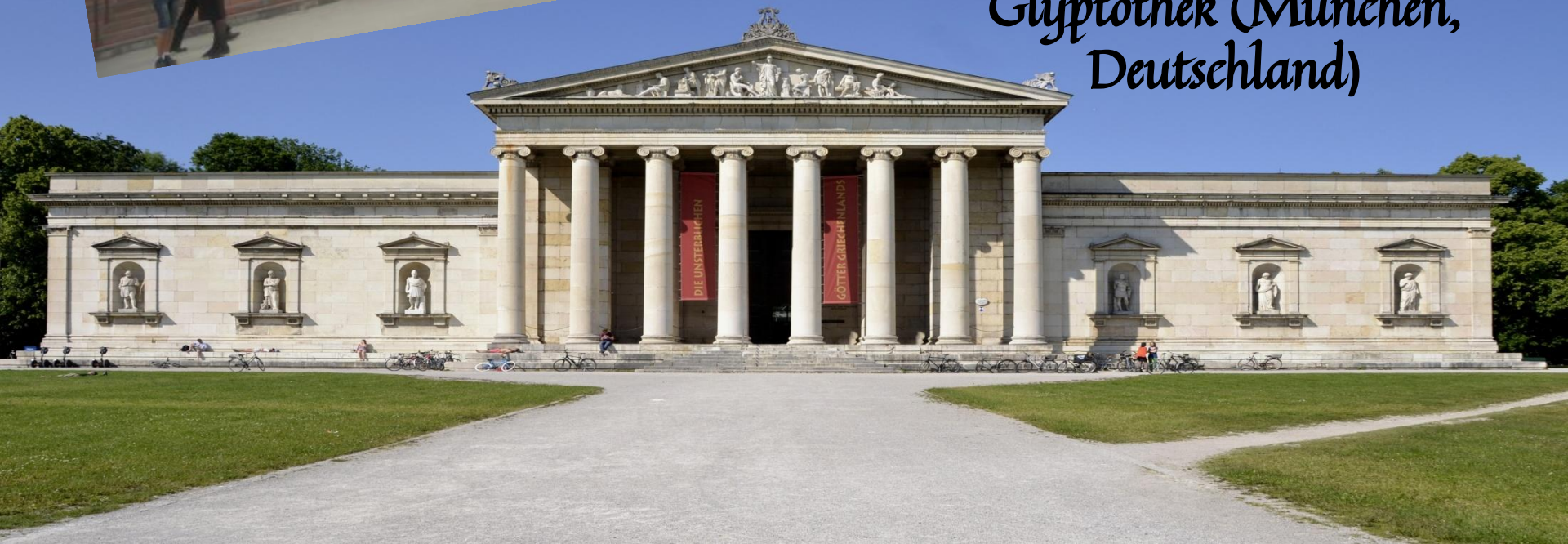
Glyptothek (München, Deutschland)