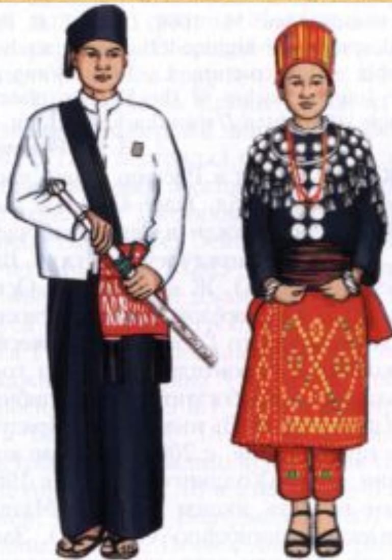
Качины. Традиционный костюм.