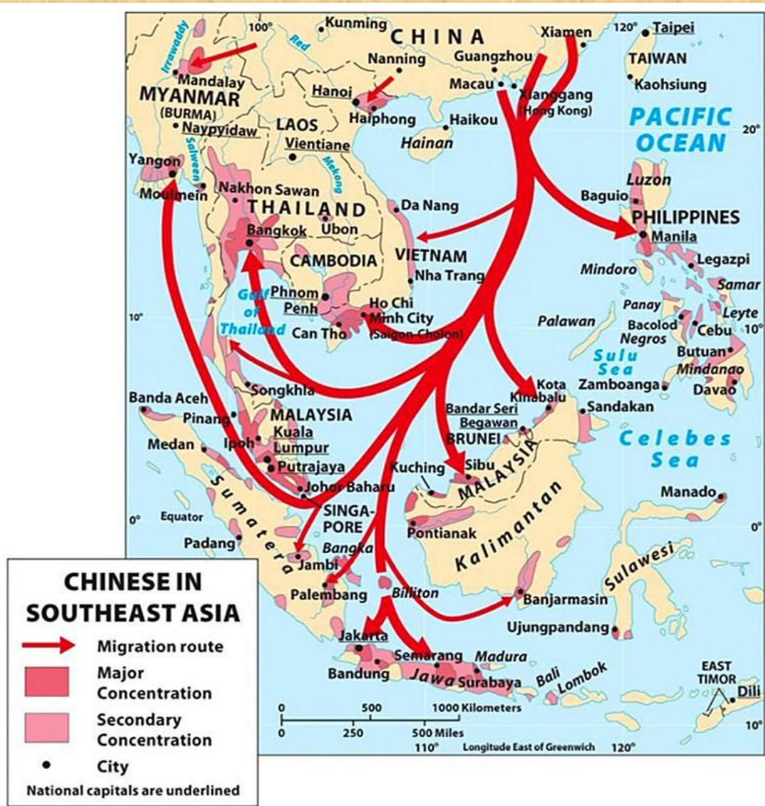
Figure 3.13