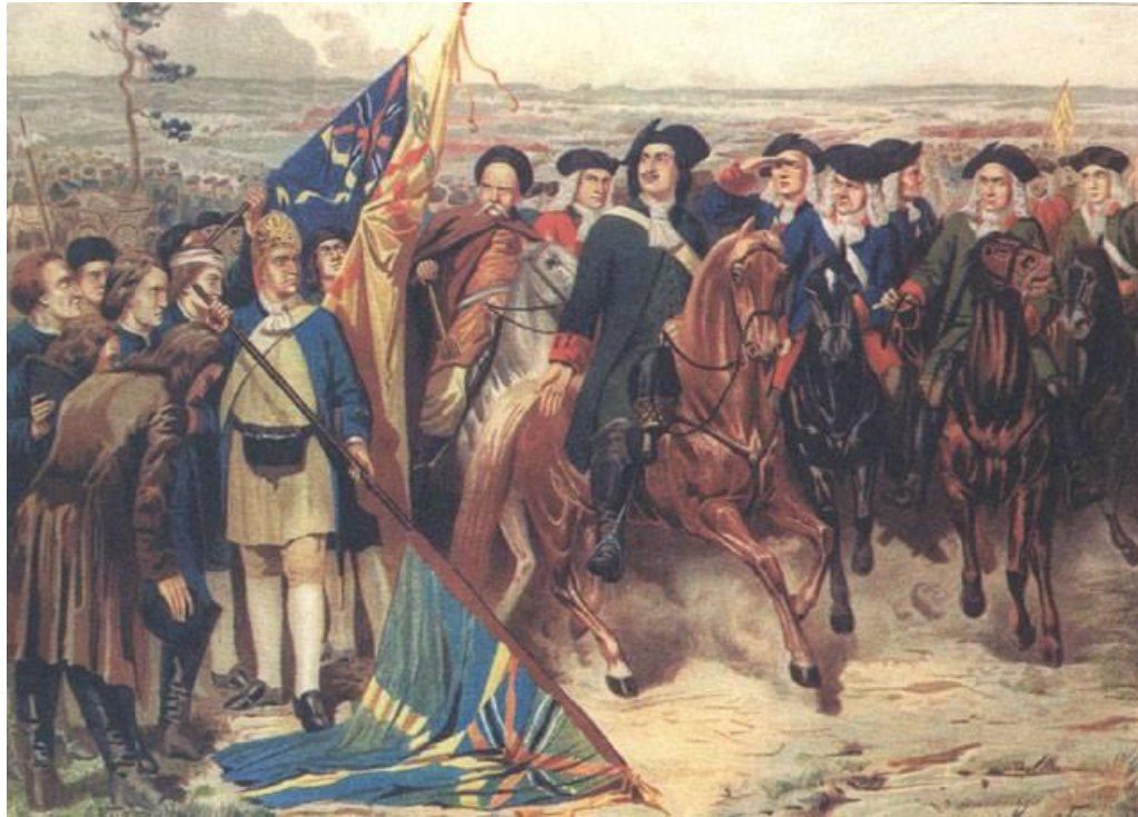
Шведы преклоняют знамена перед Петром I

Разбитые шведы бежали к переправам через Днепр. Русские потери составили 1345 человек убитыми и 3290 ранеными. Потери шведов — свыше 9 тыс. убитых и более 2800 пленных. В числе пленных оказались фельдмаршал Реншильд и канцлер Пипер. Остатки бежавшей шведской армии 29 июня (10 июля) вышли к Переволочне. Из-за отсутствия переправочных средств удалось переправить на другой берег Днепра только короля Карла и гетмана Мазепу с приближенными и личной охраной. Остальные войска — 16 тыс. человек во главе с Левенгауптом, сдались в плен. Король Карл XII со свитой бежал во владения Османской империи.