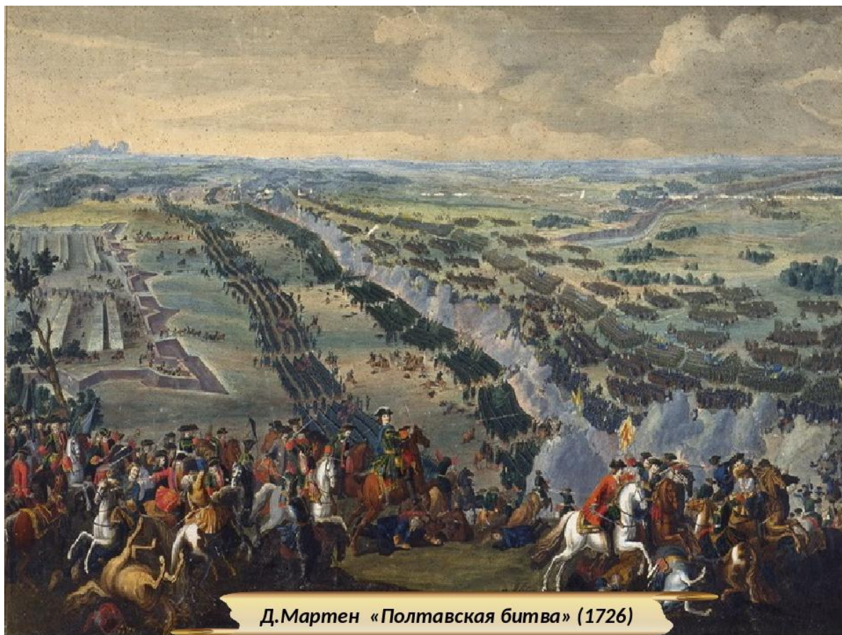
Д.Мартен «Полтавская битва» (1726)

Полтавская битва — генеральное сражение Северной между русскими войсками под командованием Петра Первого и шведской армией Карла XII. Битва состоялась утром 27 июня (8 июля) 1709 года (28 июня по шведскому календарю) в 6 верстах от города Полтавы (Русское царство). Разгром шведской армии привёл к перелому в Северной войне в пользу России и, в результате победы в Северной войне, к концу господства Швеции в Европе.