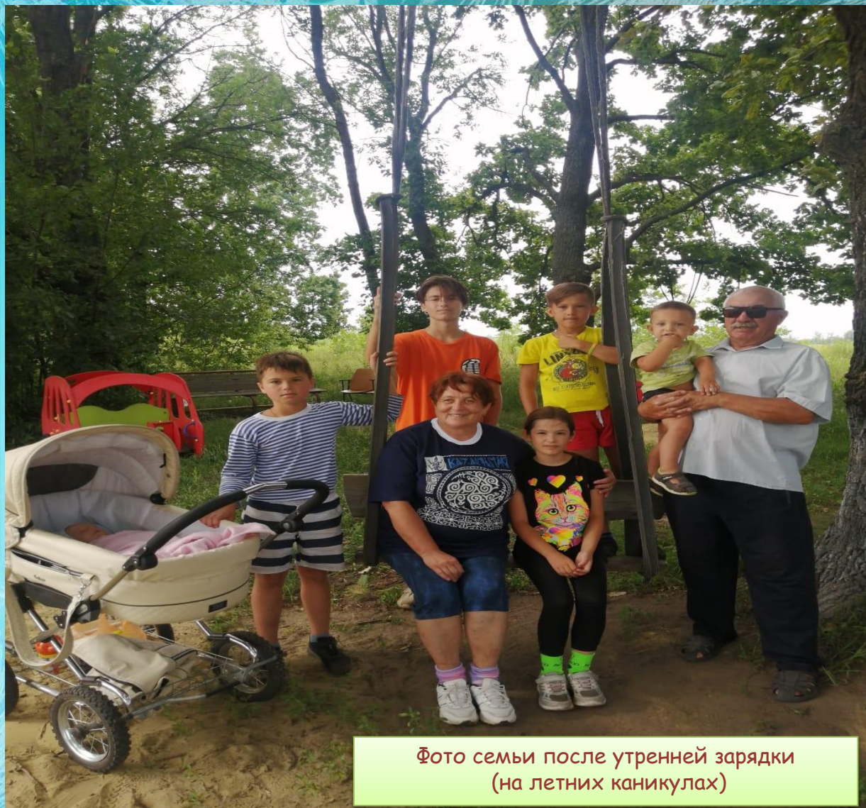
Фото семьи после утренней зарядки (на летних каникулах)