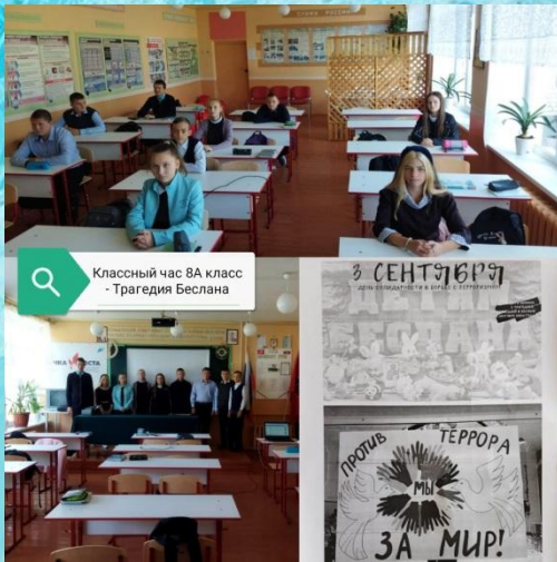
Классный час 8А класс - Трагедия Беслана