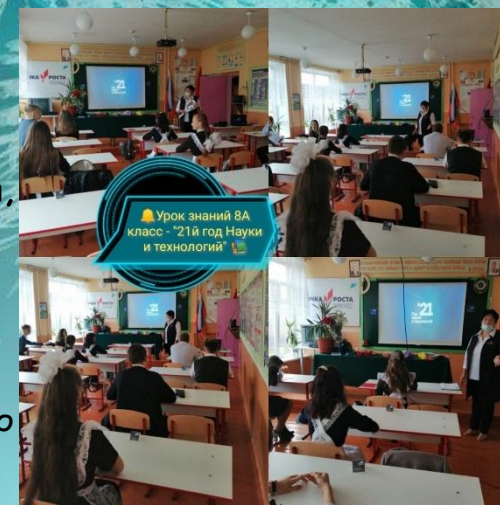
Урок знаний 8А класс - "21й год Науки и технологий"