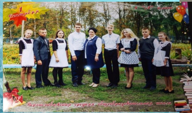
Встреча года жизни среди нас адидсадразадиметониз аисова