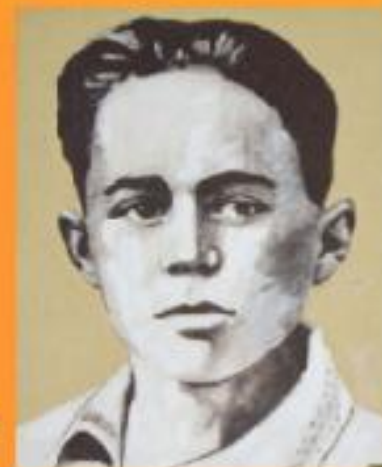
Володя Дубинин (партизан-разведчик)