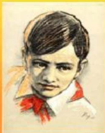
Валя Котик (партизан-разведчик)