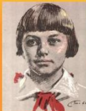
Зина Портнова (партизанка)