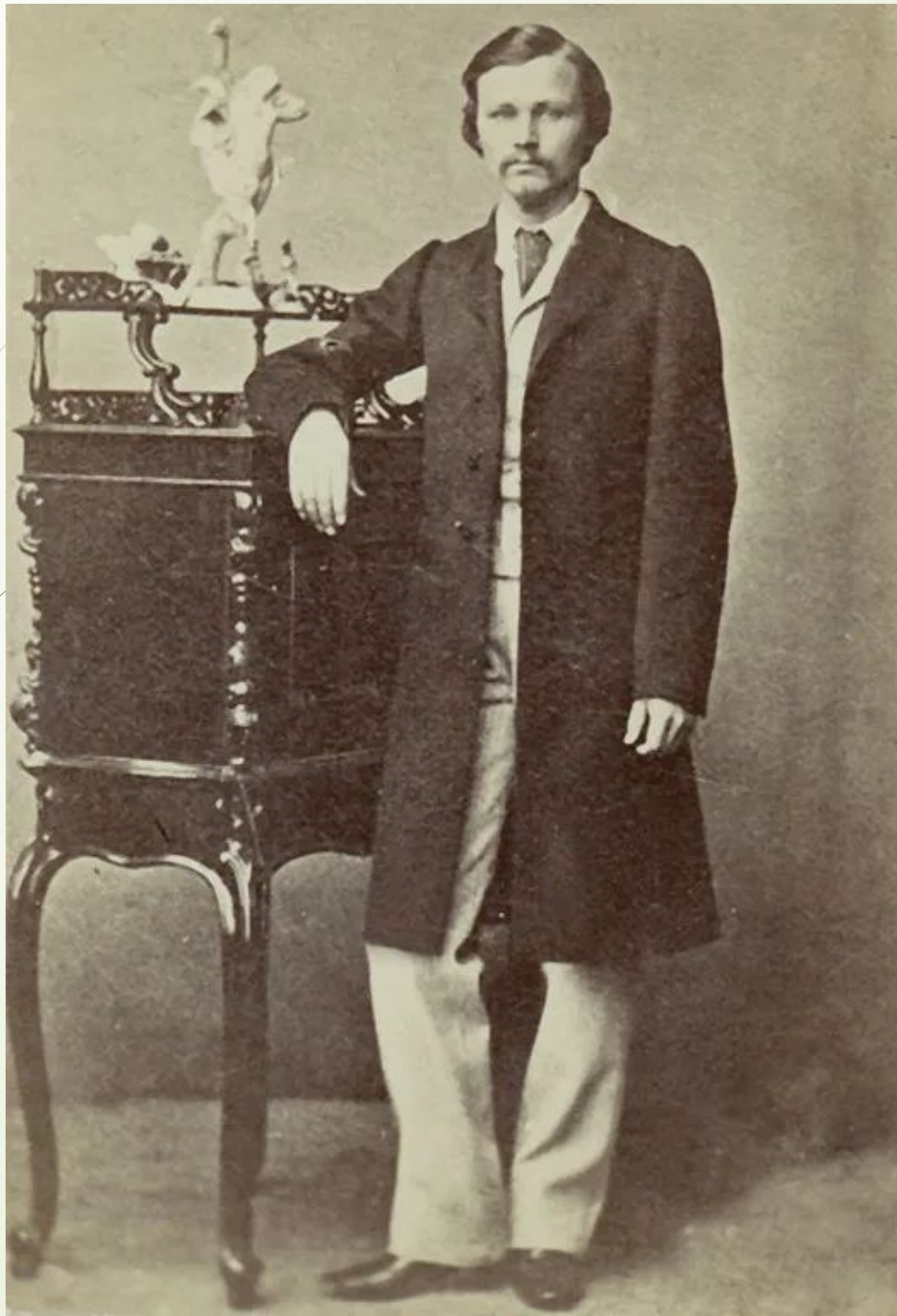
Никола́й Васи́льевич Успе́нский