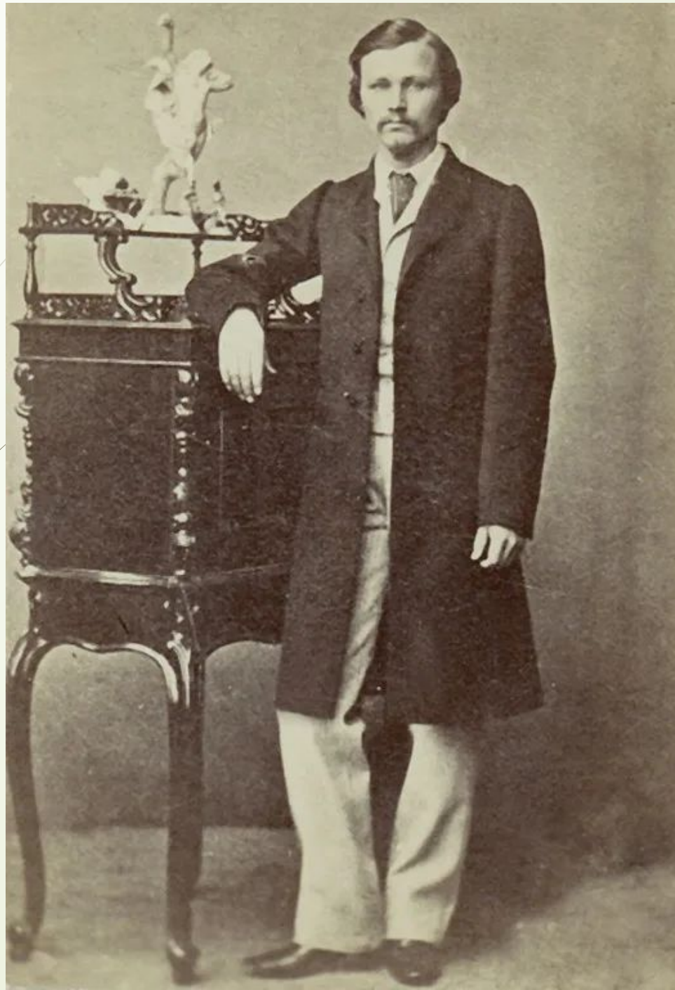
Никола́й Васи́льевич Успе́нский