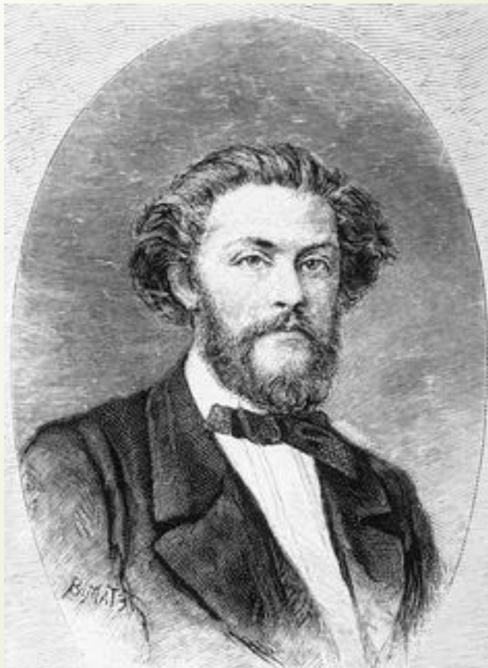
Н. Г. Помяловский